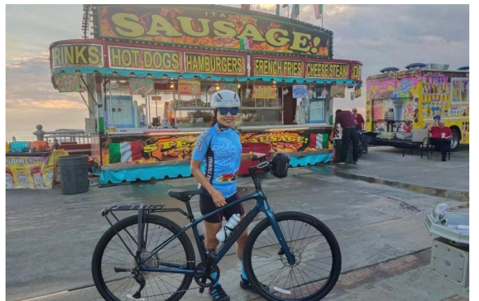
8 Calories brûlées, calories récupérées!"