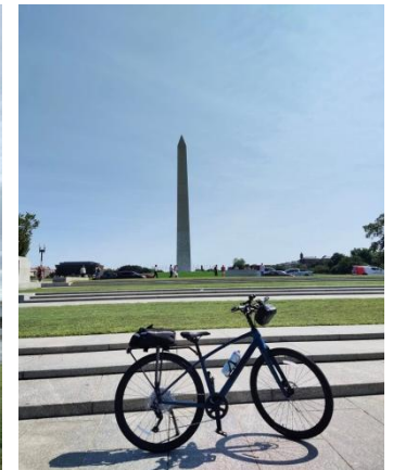
6 Washington Monument