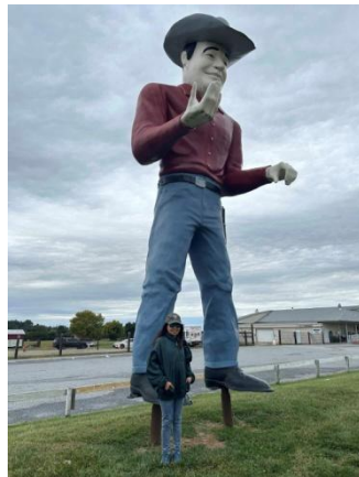
5 L'esprit Far West américain.