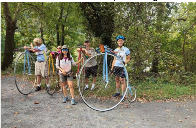
7 Sûr, avec ces vélos, on ne passe pas inaperçues