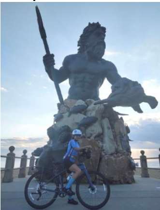
3 Neptune, dieu de la mer