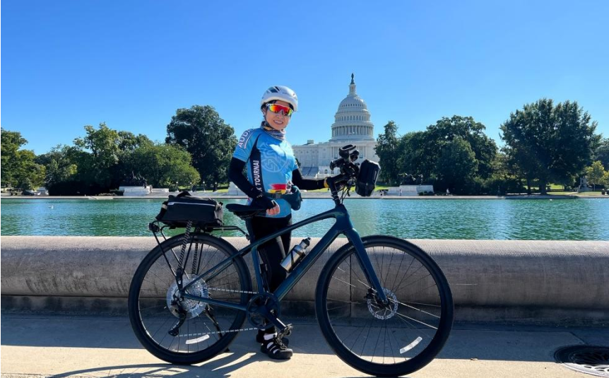
1 Un premier arrêt face au Capitole

Frites, gaufres et chocolat belge, c'était bien sympa avec Tick et Ratt. Mais l'appel de l'Oncle Sam était trop fort ! qui sait quelles autres surprises nous réservent les States ?