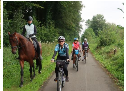
10 Le Vieux Canal, que ce soit près ou loin, on peut s'y rendre à vélo. Il y a des pistes cyclables partout