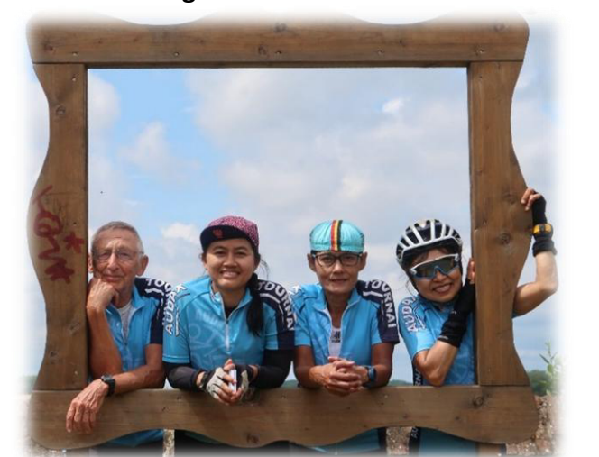
18 Le long du Ravel, on peut parfois faire une pose photo