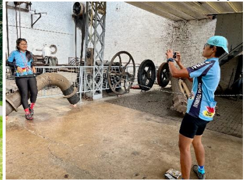
9 Pose photo au Musée de la Mine