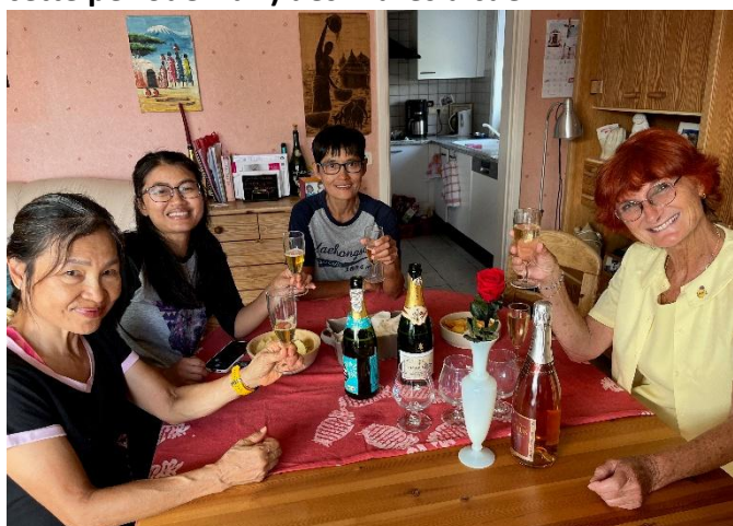
17 A l'issue du séjour, bulles de circonstances