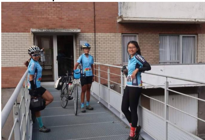
5 6 Nous sommes prêtes pour le départ. Le Lion nous attend, y-a plus que les 226 marches à gravir