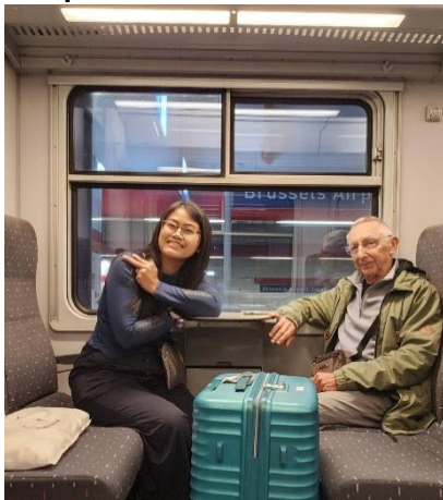
1 Sur le trajet en train de Bruxelles à La Louvière, j'étais ravie de voir défiler les éoliennes