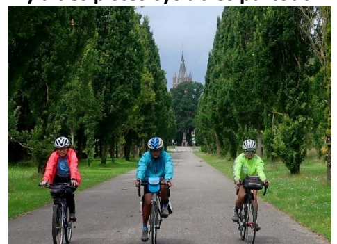
12 A Seneffe, magnifique allée menant au remarquable château de Seneffe datant du 18 ème siècle