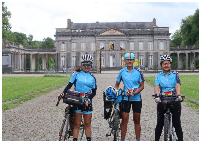
13 Trois Audaxette au château... de Seneffe !