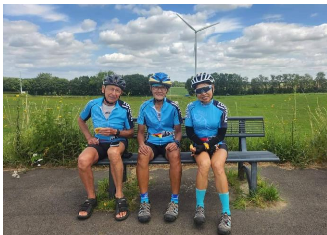
14 Banc accueillant pour une dernière photo d'éolienne