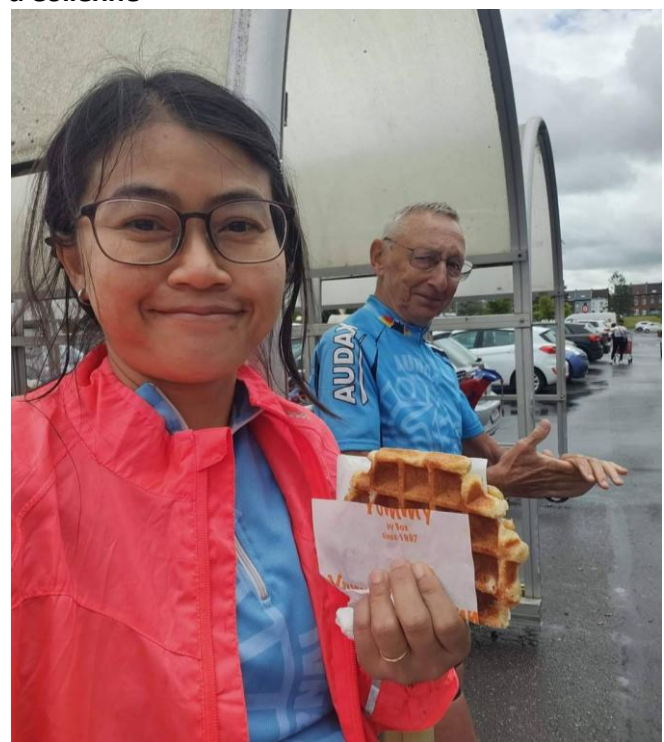
16 Les bonnes gaufres de Bruxelles