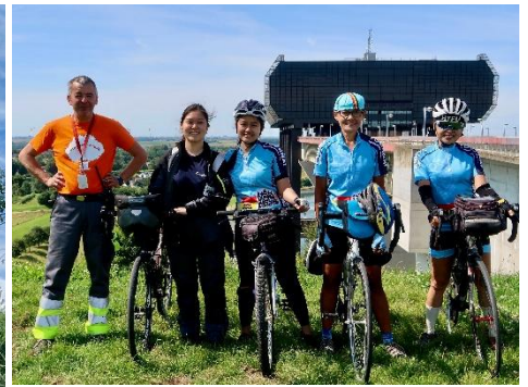
8 L'ascenseur à bateaux de Strépy