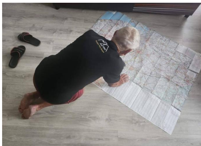
4 Carte routière pour analyser la direction du vent avec une application sur son téléphone