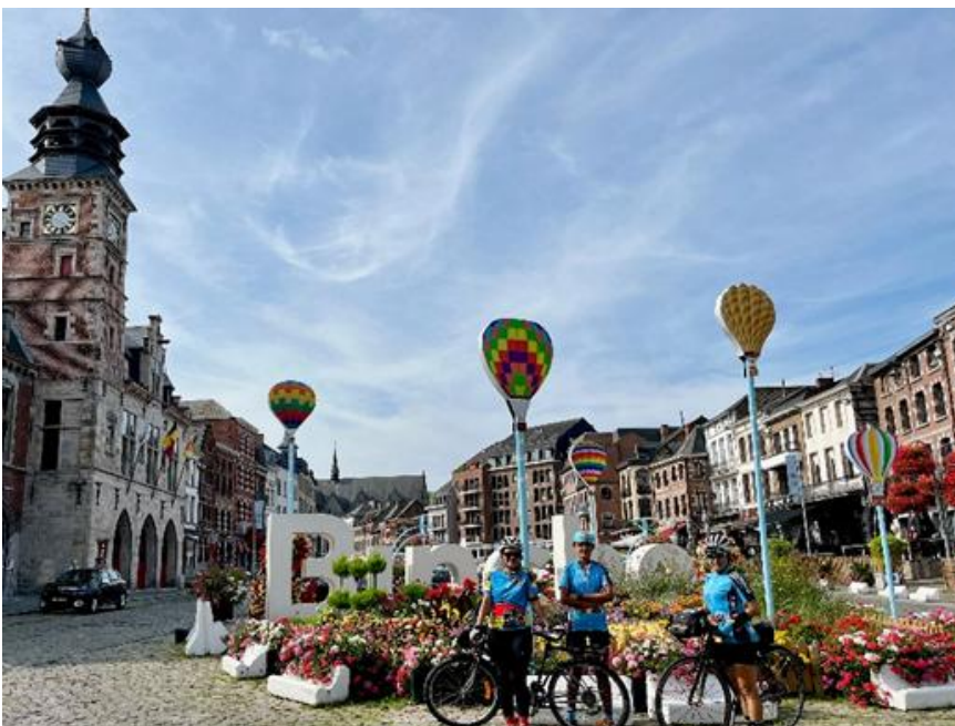
11 Mais avec trois Audaxettes, ça promet une belle randonnée à vélo ! Nous allons explorer les environs de Binche, découvrir des coins charmants et profiter du paysage à notre rythme