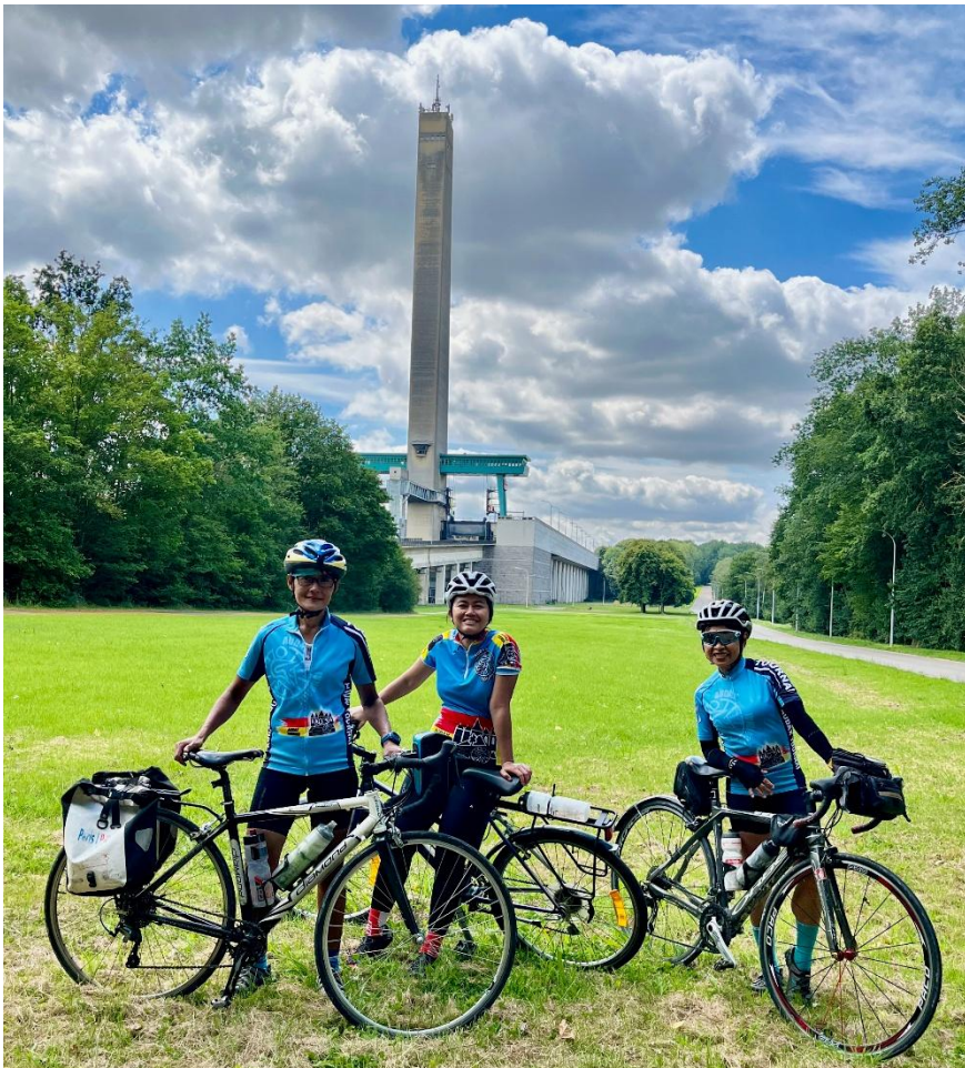
7 Solution astucieuse pour que les bateaux franchissent le dénivelé. Il a fallu 7 ans pour le construire et les bacs peuvent transporter des bateaux jusqu'à 1350 tonnes ! Nous y posons fièrement toutes les trois