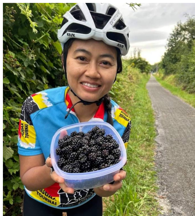
15 Il y a toujours des endroits pour pique-niquer pendant le déjeuner et on y trouve toujours (à cette période-ndlr) des mûres à cueillir