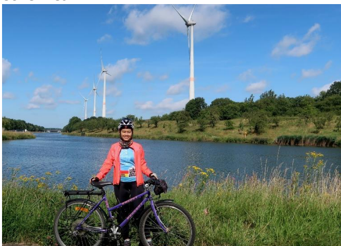
3 Excellente idée de faire du vélo et admirer les éoliennes de près ! Cela m'a rendue heureuse