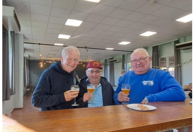
47 Ou peut-être une tournée de bières pour tout le monde? Non !