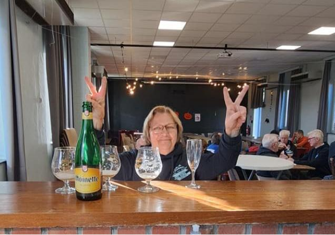
46 Et voilà, budget équilibré, comptes au vert! On mérite bien une médaille."