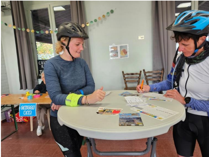
6 Devoir d'inscription avec le sourire