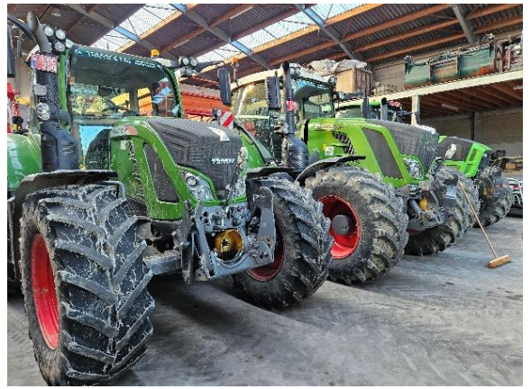
19 Je suis sûr que le Fendt 828 a un calendrier de compétitions de labour caché quelque part et peut-être même une playlist de musique country pour les longues journées aux champs!"