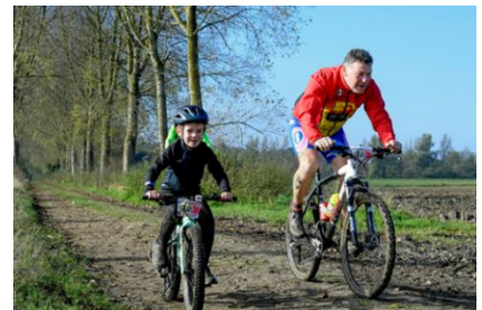
26 Père et fils en écolage