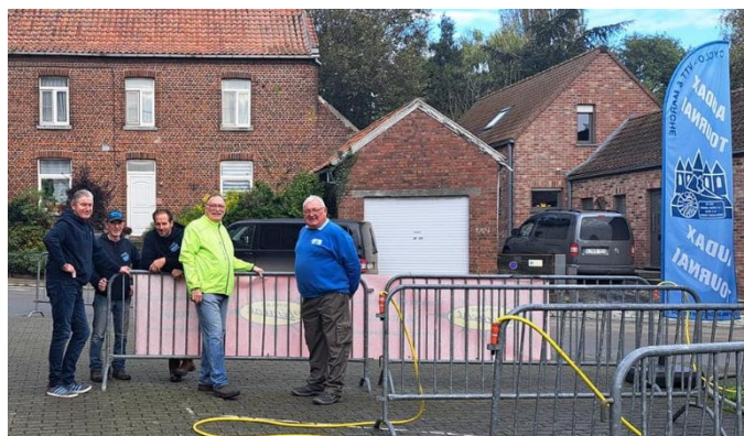
10 Raccordement des tuyaux. Ça marche