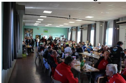
42 Salle comble, une trésorière heureuse