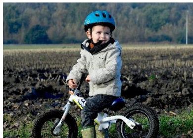
25 Un futur Audax prêt pour une aventure boueuse!