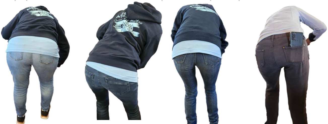
49 Les anonymes en pleine action de nettoyage, de dos, ça donne un spectacle assez hilarant! On pourrait presque appeler ça une danse synchronisée! Rien de tel pour terminer sur une note légère et amusante d'une 36 ème Jubaru Bikers réussie.