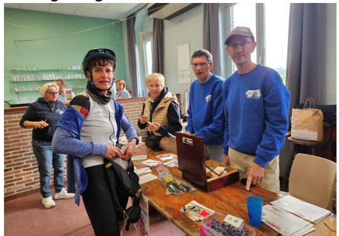
des affiliés ou des non-affiliés