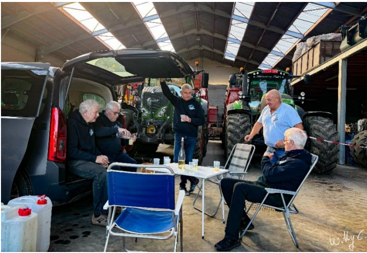
18 La nouvelle mode à la ferme du Moulin de Barbissart : les pique-niques de hangar avec vue sur tracteurs