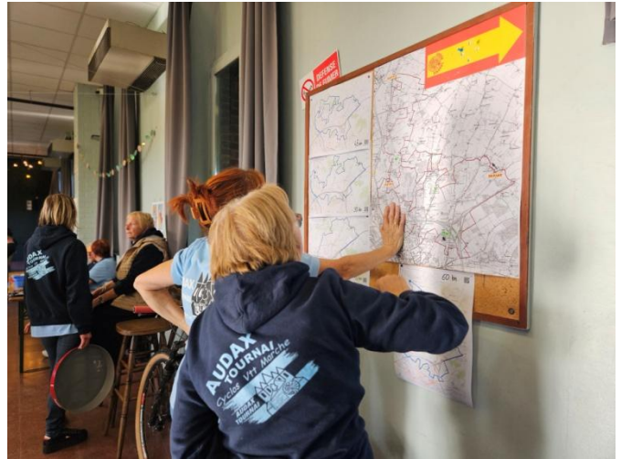
7 Passage obligé et la carte et la caisse !