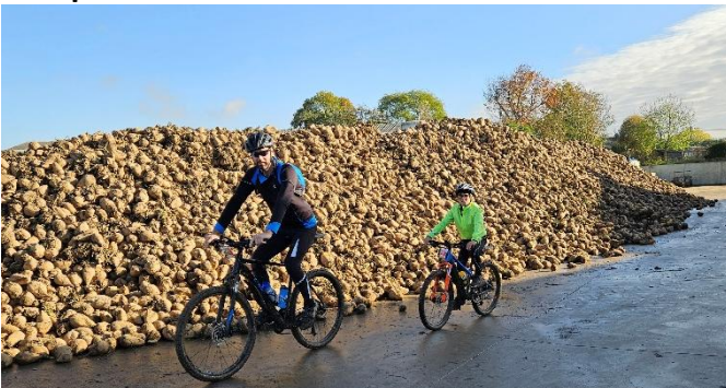
22 "À quand la course de VTT au milieu des betteraves?"