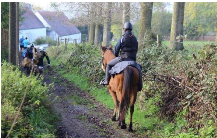
24 Joli partage avec des compagnons inattendus!