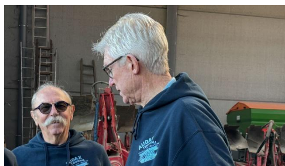
17 On dit que les Audaxettes préparent un coup de maître!