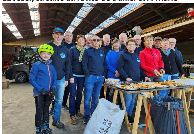
14 Rien de tel qu'une pause photo sucrée