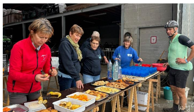
15 Si seulement on pouvait remorquer ce buffet derrière nos vélos.