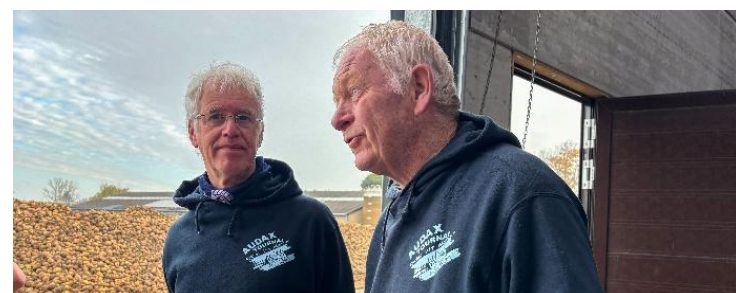
16 Regarde ce tas de betteraves, si on n'a pas assez, on n'aura qu'à se servir