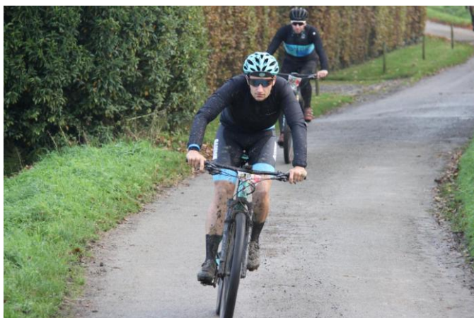
37 Rien de mieux qu'un peu de boue pour rendre la balade encore plus mémorable