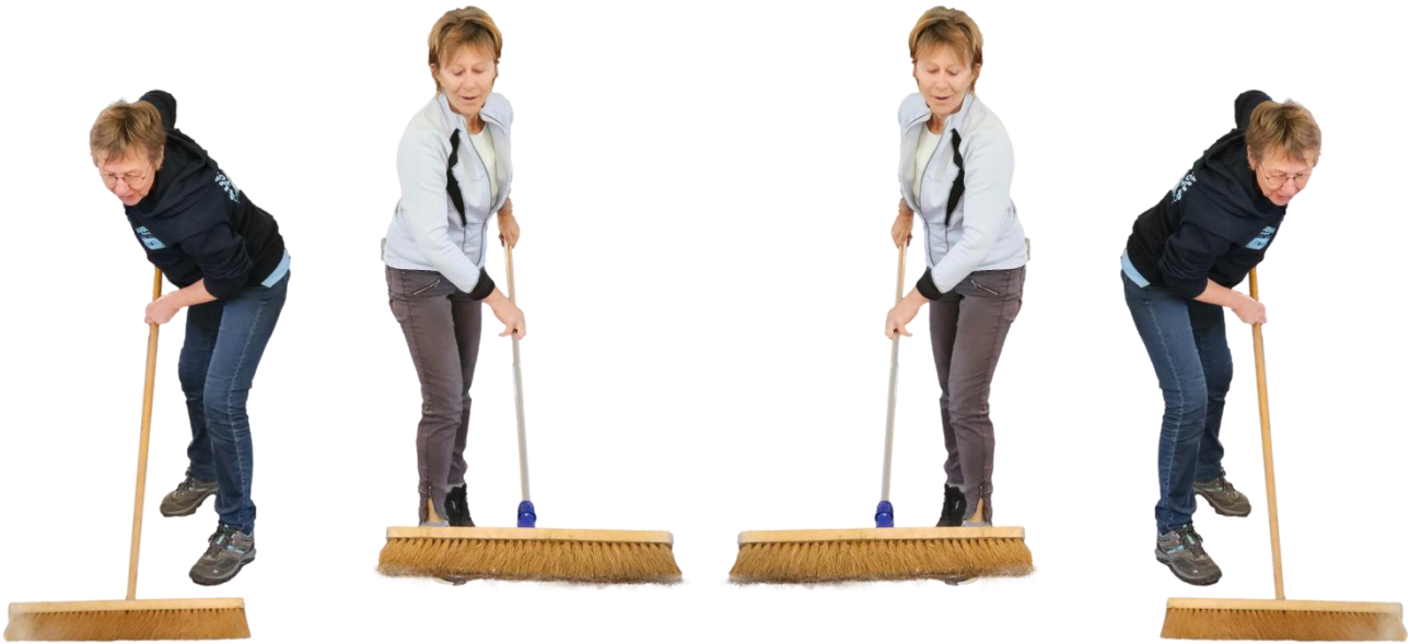
48 Les balayeuses en action, c'est tout un spectacle! Les "Catherine "en compétition pour le trophée de la propreté! En tout cas, elles ont un sacré coup de balai! Propre et rapide."