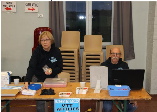
8 La caisse, c'est vite dit, faudrait il encore savoir celle