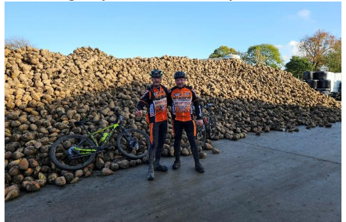
21 Tu penses qu'on peut en ramener quelques-unes pour le dîner? Imagine une bonne soupe