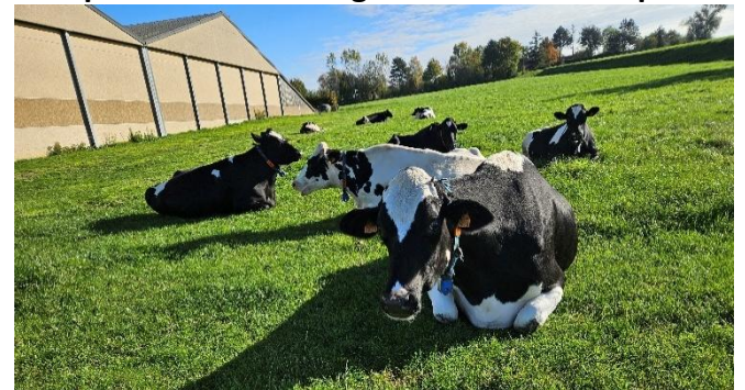
23 Toujours en train de se plaindre qu'il n'y a pas assez de boue!