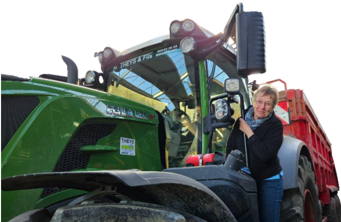
20 "Hé, avec ce monstre de puissance, on va plus vite qu'à vélo !"