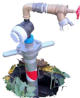
4 Col de cygne en place