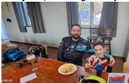
41 Papa la Moinette, cervela et coca le fiston