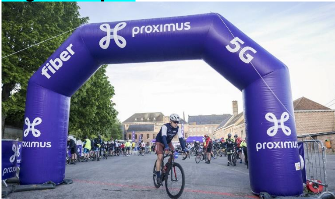
32 7h30 le départ est donné pour ce cyclo