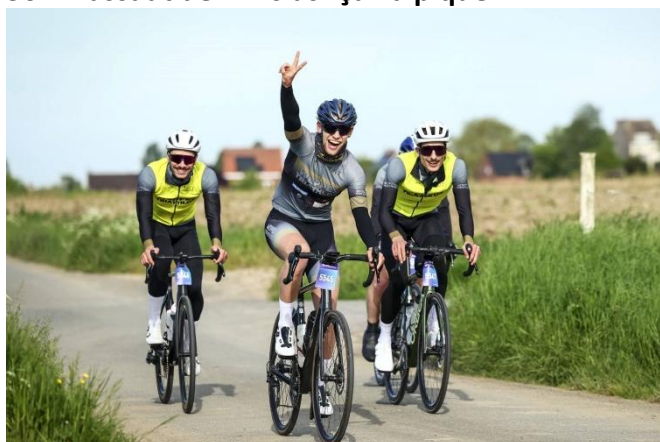
38 " V " de la victoire... Il n'en est qu'au début