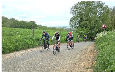
62 ici aussi on en a plein...