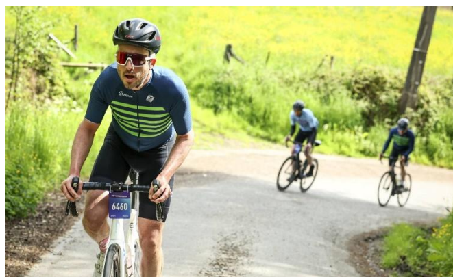
57 Virage serré Bousée la redoutable