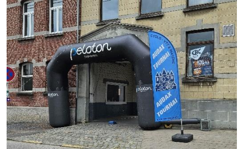
31 Portique d'entrée du collège