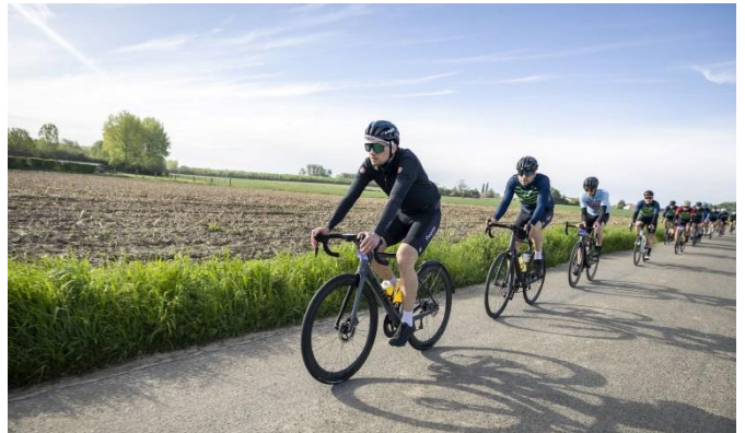
33 Petit échauffement avant le Mont de l'Enclus.