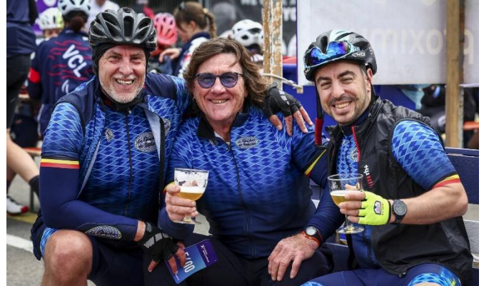
78 Deux verres pour trois il y a un bob dans l'équipe, ou alors il est déjà avalé