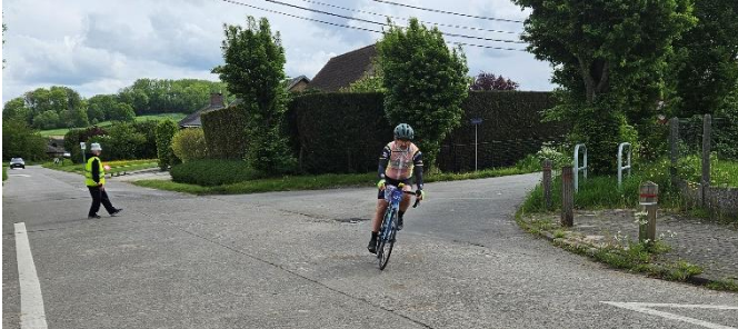
64 Remarquable travail des signaleurs

Tout cela n'aurait été possible sans eux