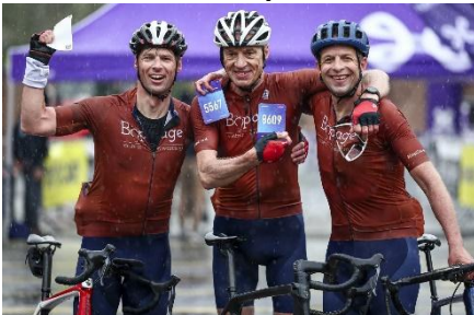
82 il pleut et alors on s'en fout Visite inattendue