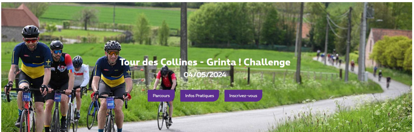
1 Promotion de l'événement via image prise lors l'édition dernière ici dans les Papins

Les Audax bénévoles ont comme chaque fois joué un rôle crucial dans le succès de l'événement. Leur dévouement et leur passion ont permis de surmonter les obstacles organisationnels. Qu'il s'agisse de la gestion des points de ravitaillement, de la sécurité des parcours, ou de l'accueil des participants, chaque bénévole a apporté une contribution inestimable. Leur engagement démontre l'importance de la communauté et de l'esprit d'équipe dans la réussite d'un tel événement.