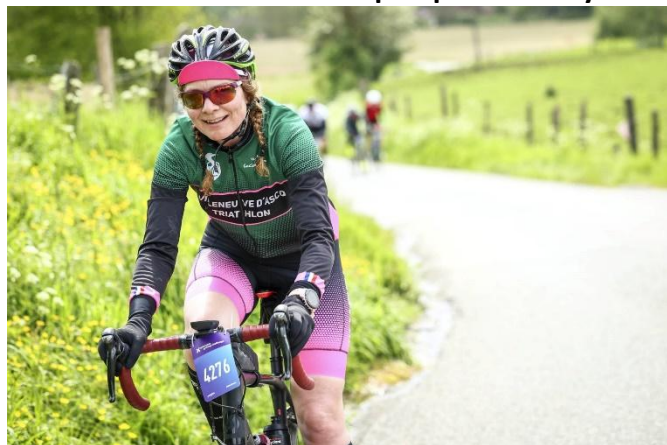
58 Cette cyclote donne l'impression de facilité