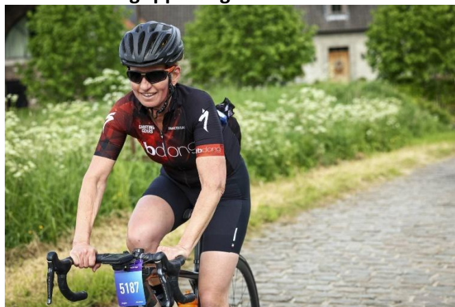
43 Le Saule Pendu et ses pavés... ça secoue