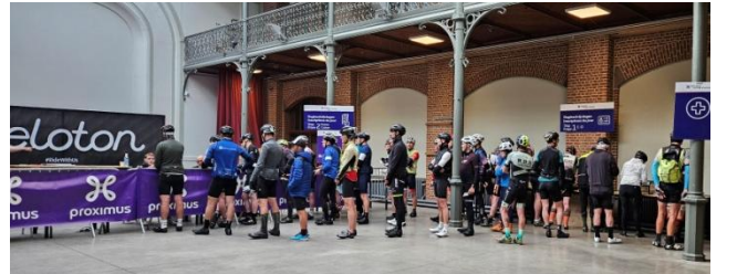
11 Octroi de la plaque de cadre après accomplissement de la formalité.