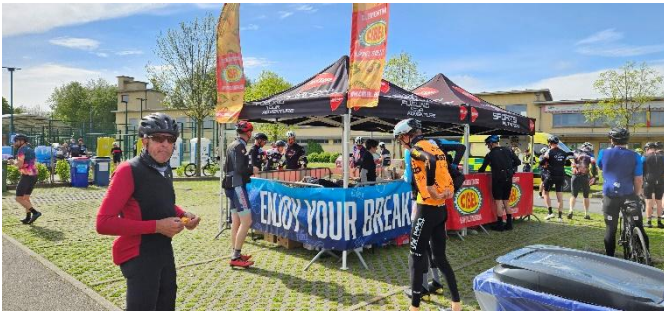
46 Flobecq 175 km il faut recharger les batteries