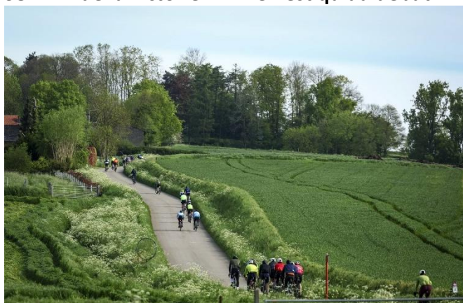
40 Côte du Trieu, les écarts se forment