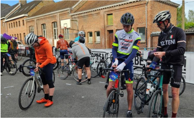
25 Chacun s'affaire à fixer sa plaque de cadre