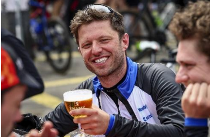
79 Quoi de mieux qu'une Ename