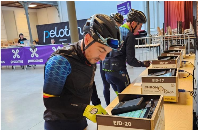
10 Moyen informatique pour les formalités