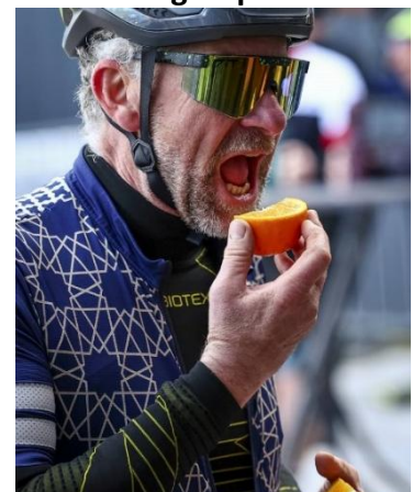
52 Les oranges ont l'air appétissantes