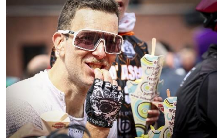
81 Une bonne frite pour finir