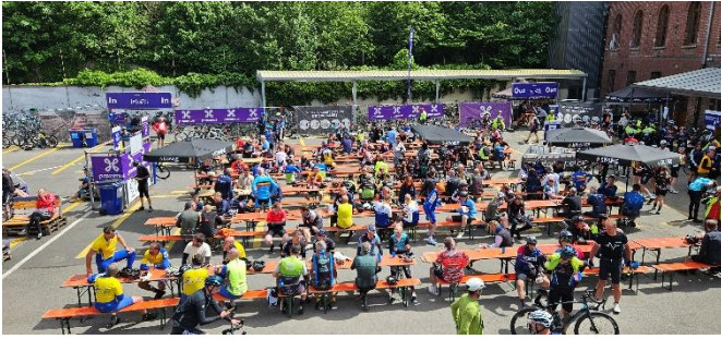
75 Une cour d'école remplie