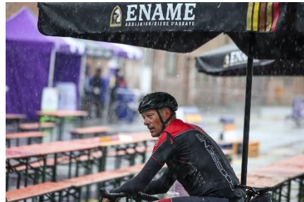
83 La pluie s'est invitée