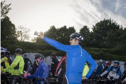
29 Dernier selfie avant le départ