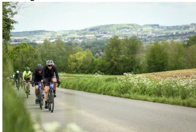
59 Les monts frasnois sont derrière nous, mais...