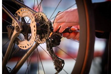
30 Ultime réglage du dérailleur