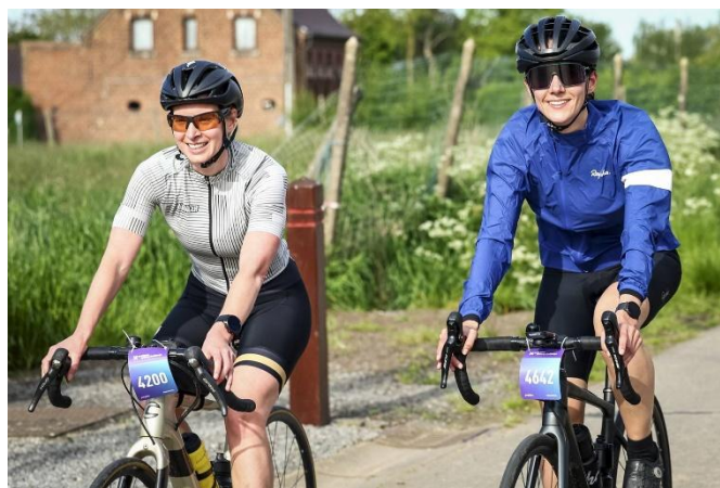
37 Curieux les dames sont moins frileuses