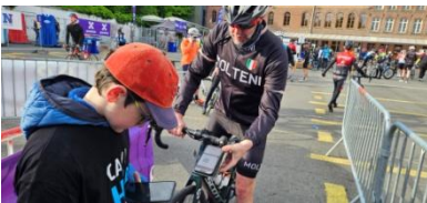
23 C'est en ordre pour le scan