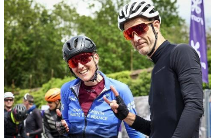
80 C'est ok on reviendra