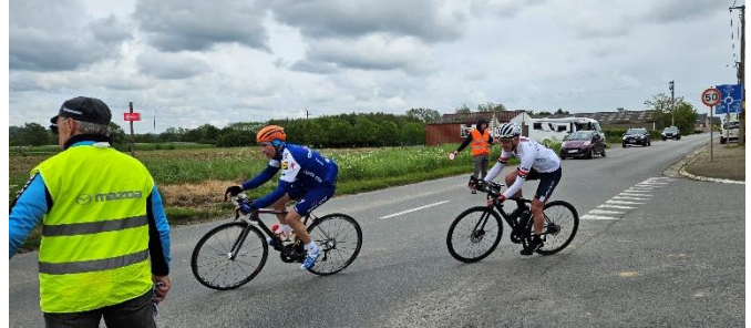
65 Un " Merci ou Danku " gratifiant au passage