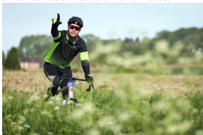
39 Coup de pouce " Tout va bien "