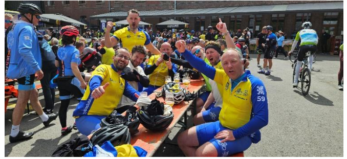
76 Les héros fiers de leur participation