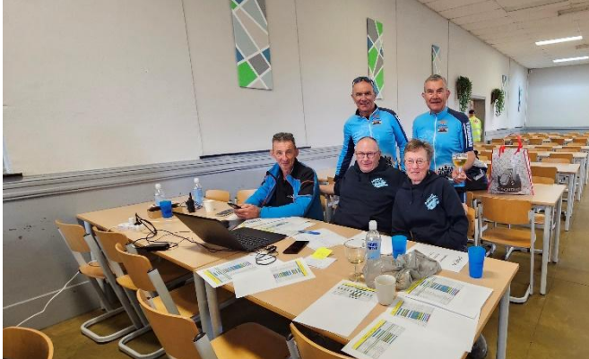
77 A la table SOS rien à faire, calme plat Troisième mi-temps et clap de fin