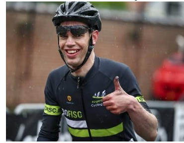
84 Pouce levé et sourire