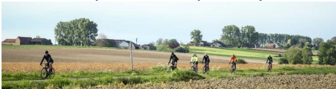
34 Chacun va selon ses possibilités