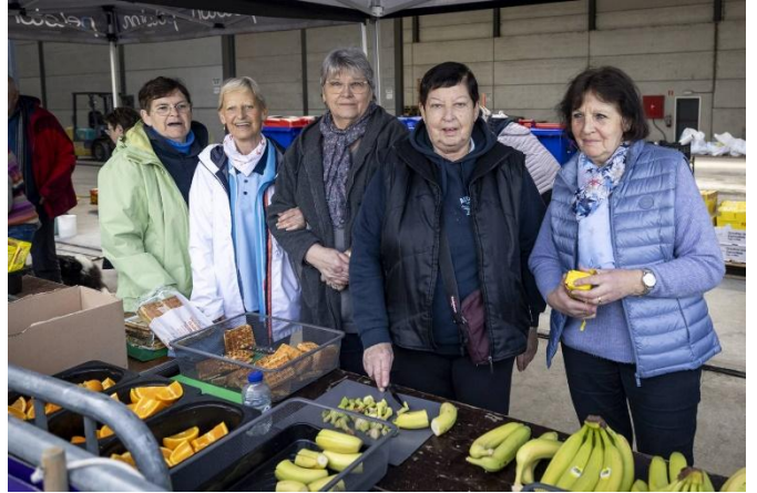
45 Même chose pour ces dames