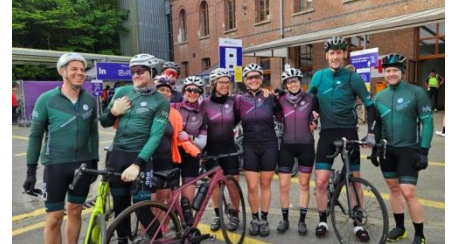
21 Les " Baroudeurs " Groupe mixte venus de Dossche