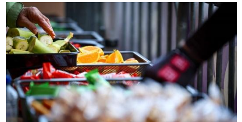
49 Ravito de qualité