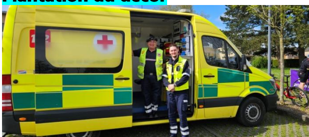
4 Les services de secours sont en place