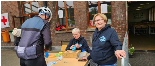
68 Tout cela sous l'œil averti de la trésorière