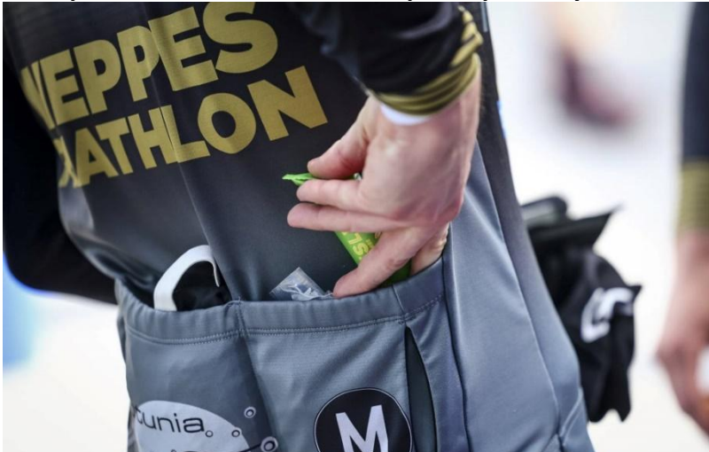
51 Une barre en poche pour éviter la fringale