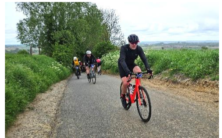
63 Ce ne pourtant pas la fin

Tout cela n'aurait été possible sans eux