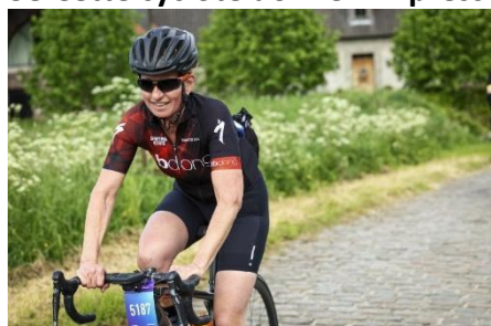
60 Les côtes se font rares, mais les sourires et les grimaces ne manquent pas à la Grinta Challenge