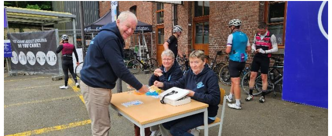
67 Au ticket même les aidants payaient leurs consos