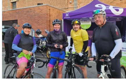
20 Petit sourire en attendant