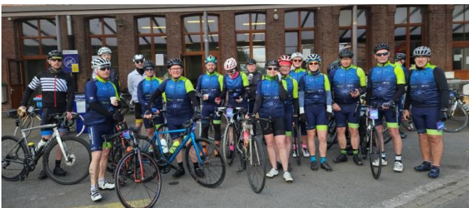
17 Dans l'attente les groupes se rassemblent