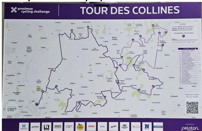
12 Carte XXL des différents parcours 85 125 165 km