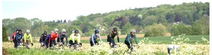
35 Des groupes se forment suivant les affinités