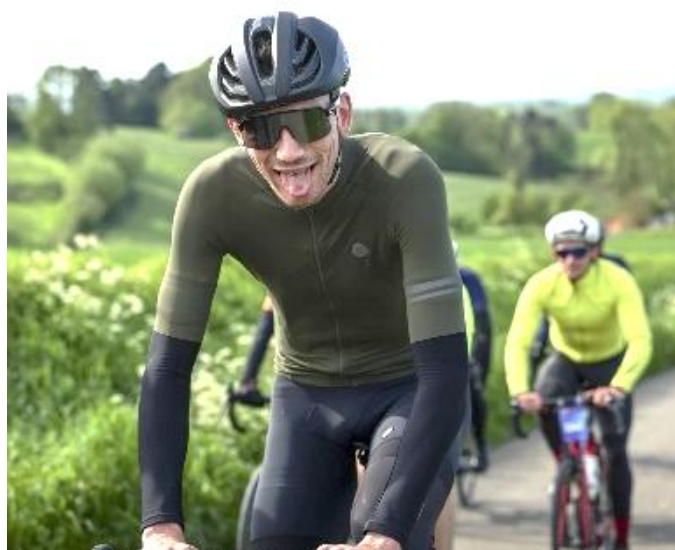
53 Dur dur mais quand on aime ... c'est extra