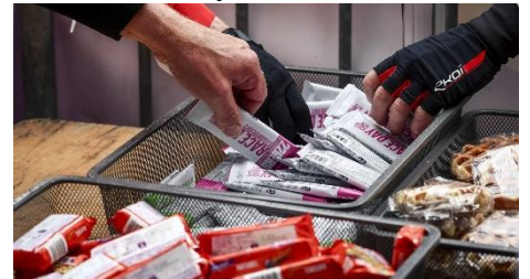
50 Barres énergétiques à foison