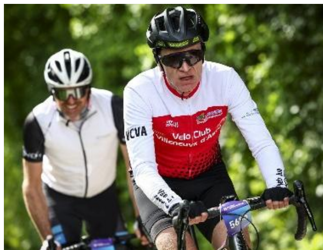
54 Grimace, visage crispé, on s'accroche le sommet n'est plus bien loin