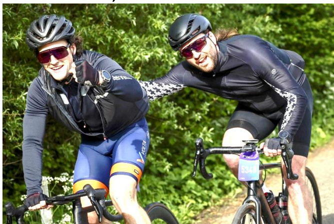
42 Poussette ou tirage de maillot, tout est bon