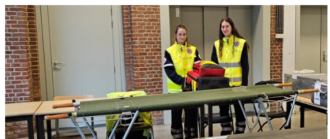
5 Dernière vérification du matériel