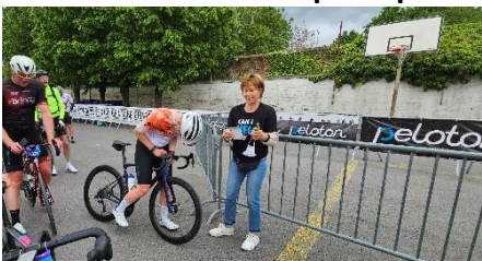
72 Un travail d'équipe