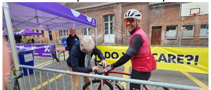
71 Retour à Kain Fred retire la plaque de cadre