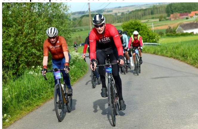
41 Chacun s'agrippe au guidon