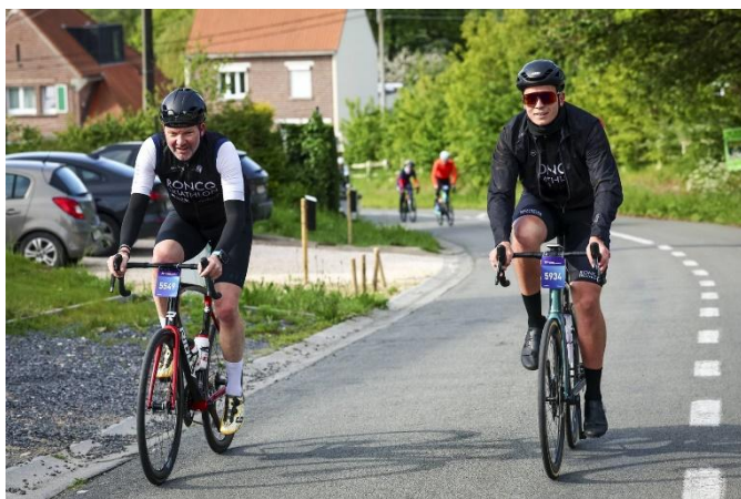
36 A l'assaut de l'Enclus. Ça va piquer