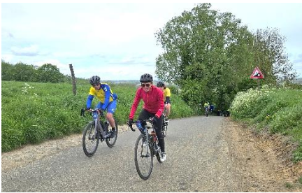
61 Le Trou Robin et ses pourcents