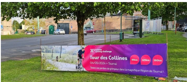
2 Banderole publicitaire pour l'édition 2024