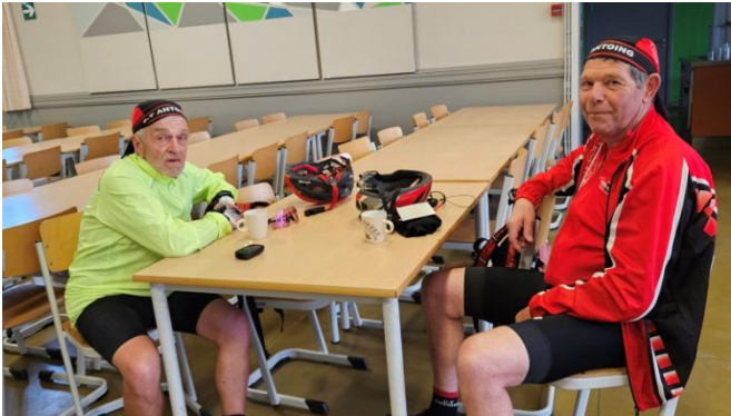
8 " Petit noir " pour deux cyclos du CT Antoing