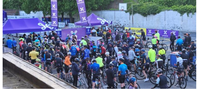
16 L'ambiance monte avant le départ fixé à 7h30. Chacun se concentre avant le passage des scans de contrôle des plaques de départ.