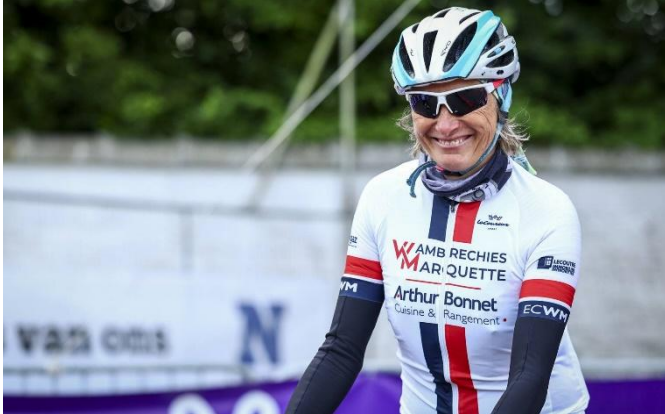
27 Venue de Wambrechies et toute souriante