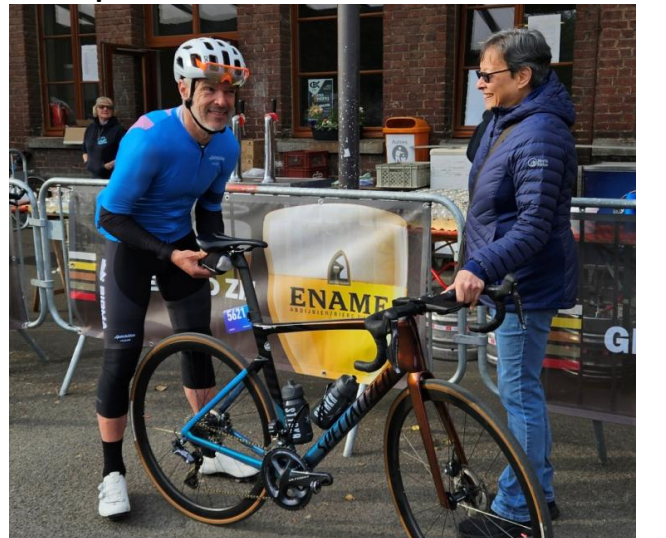
13 Madame tient son magnifique vélo pendant que son champion affine les derniers réglages.