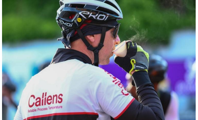
28 On ne peut pas dire que le café ne fume pas