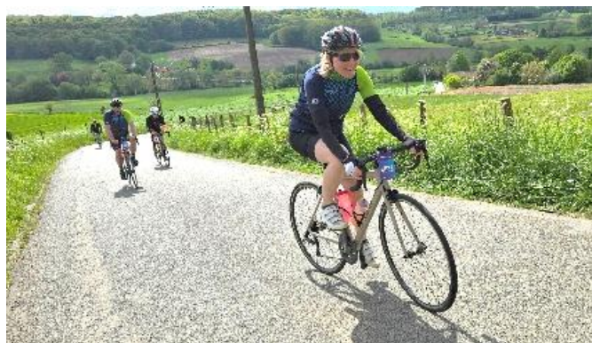
56 Sourire au sommet des Papins pour cette cyclote