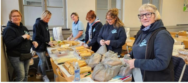
6 Préparation des lunches packets