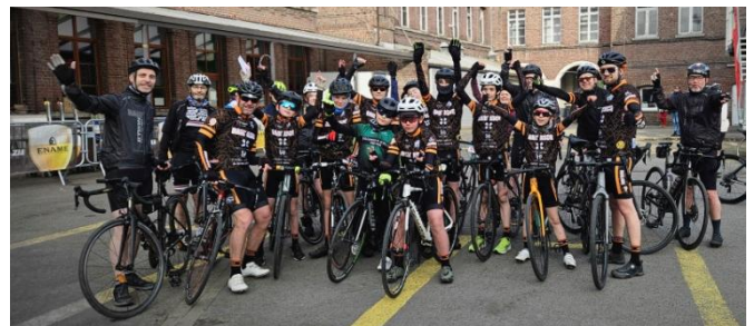
18 Venus de Villeneuve d'Ascq à vélo pour le 85 km