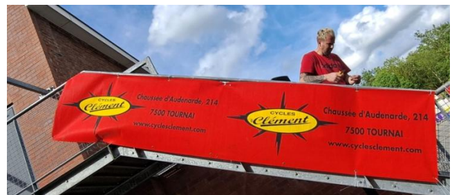
3 Participation des vélocistes locaux

Les retours des participants ont été majoritairement positifs, soulignant l'excellent travail des bénévoles et l'organisation générale malgré les imprévus. Le Tour des Collines, Proximus Challenge continue de gagner en popularité et en reconnaissance, grâce, en grande partie, à l'engagement des Audax et à la passion des organisateurs. Cette édition a non seulement renforcé la réputation de l'événement, mais elle a également montré que, face aux difficultés, la solidarité et l'entraide peuvent transformer les défis en succès.