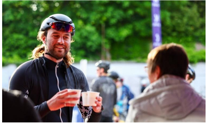
26 D'autres en sont encore au petit café