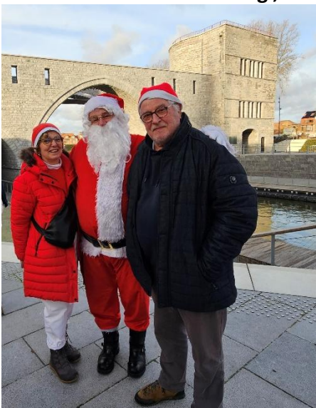
8 Le couple présidentiel heureux de cette organisation et qui plus est sous un ciel "Bleu" Audax