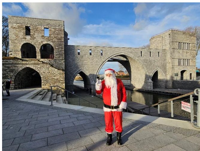
5 Avec le bonjour du Père Noël