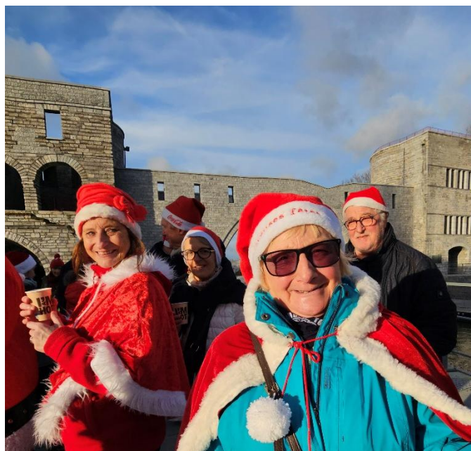
6 Les sourires en disent long , Père Noël c'est bien