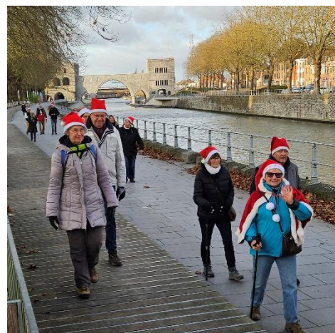
12 Il est temps de prendre le chemin du retour en longeant l'Escaut