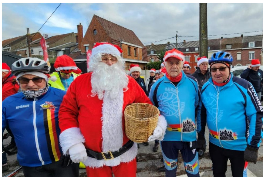
2 Chacun y va de son déguisement, bonnet, casquette... et sourire