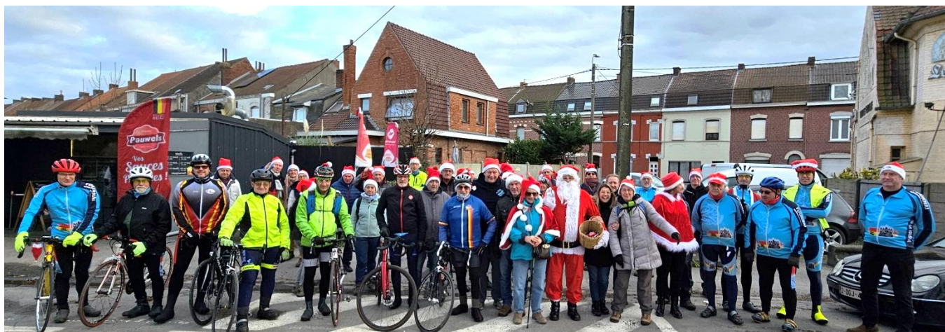
1 Les Audax Tournai sont restés de grands enfants, la venue du Père Noël apporte le succès à cette organisation. Les déguisements sont respectés

Cette sortie festive a une fois de plus démontré l'esprit de camaraderie qui règne au sein du Royal Audax Tournai. Un moment convivial pour partager, un bon moment entre amis.