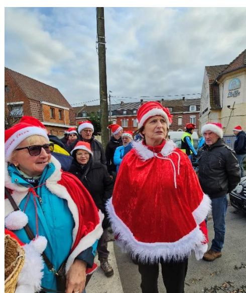
3 Cape pour les mères Noël