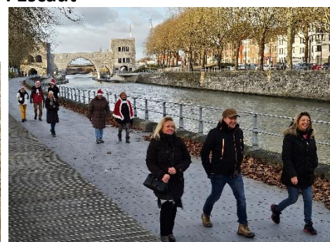
13 La famille Tomme venue en renfort