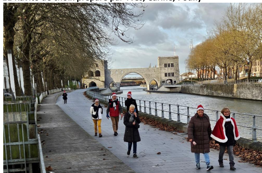
14 Chacun y va à son rythme, rien ne sert de courir