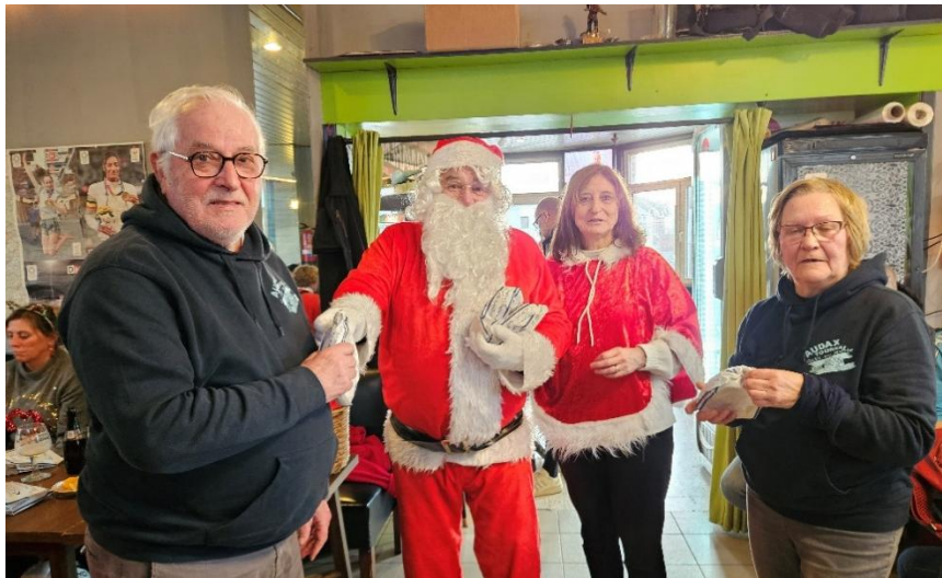
21 Le moment est arrivé, le Père Noël distribue ses cougnoles, président et vice-président trésorière, en premiers