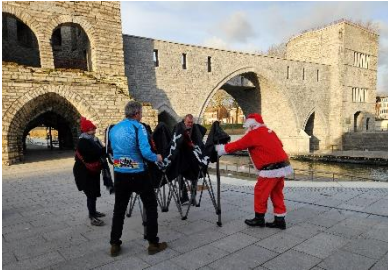
18 Le Père Noël fait tout, même plier la tonnelle