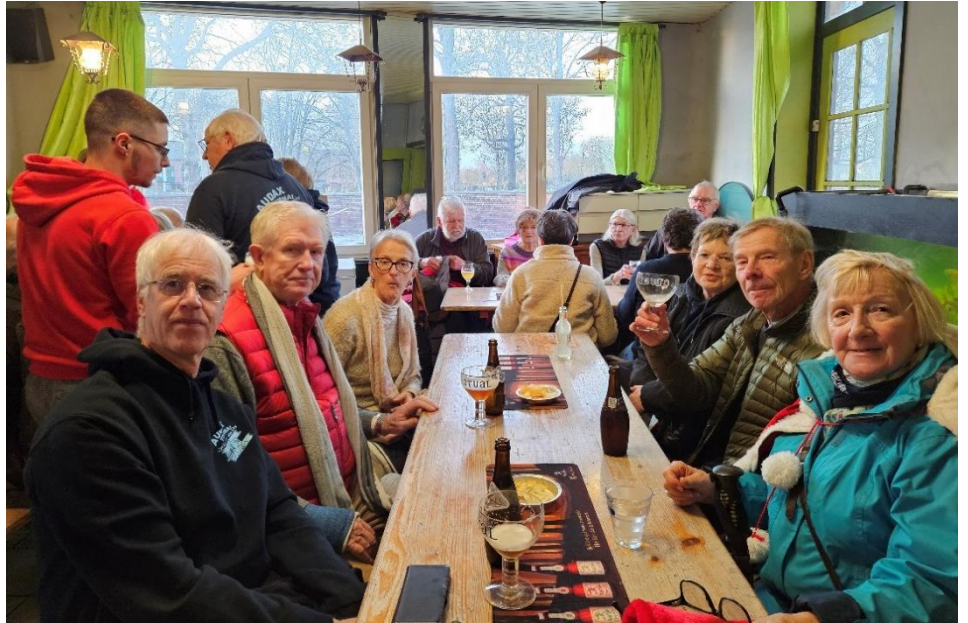
20 Dernière organisation, un succès de plus dira Marraine