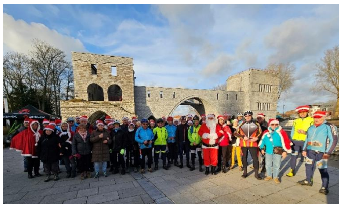
4 Après l'effort un peu de ravitaillement surprise face au Pont des Troux fera le plus grand bien aux différents groupes marcheurs et cyclos