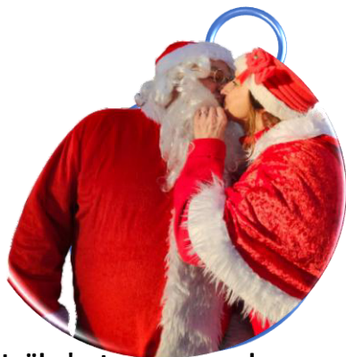
Non, le Père Noël n'est pas une ordure mais tout simplement amoureux de sa Mère Noël.