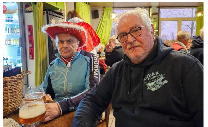
24" Là-haut, une étoile brille, Tignona la bien-nommée, guidant nos pas, tel un phare dans la nuit. Souvenir précieux d'un être cher envolé. Son éclat scintille, sa mémoire vivent en nous."