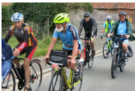
18) A peine le temps d'évoquer une Diagonale de France ou un PBP