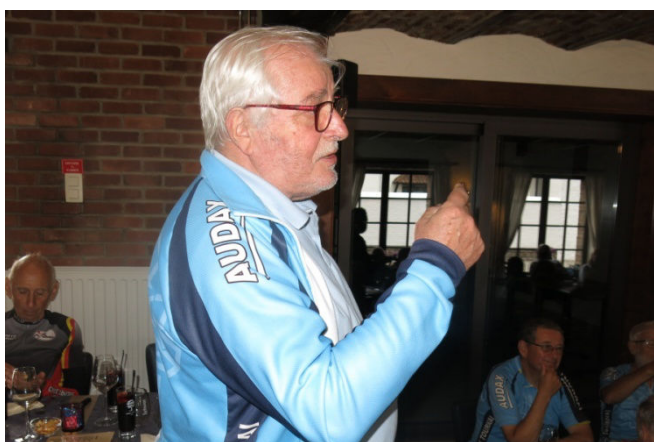
22) Toujours à l'aise à l'heure du discours, le président Jozef Tomme souhaite bon appétit à tous.