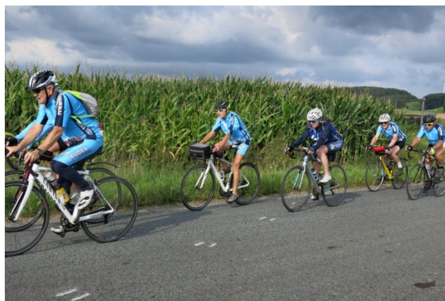
28) Retour passant par les vallonnements de Béclers mais sans le moindre problème technique.