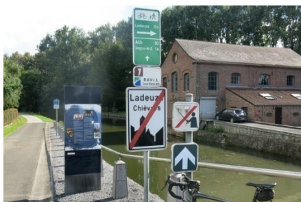
08) Ceux qui ne pensent qu'à manger arrivent à Ladeuze.