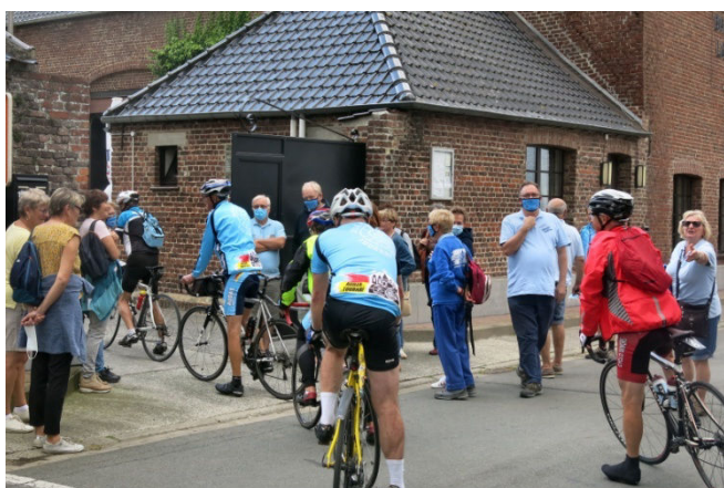
20) Entrée, en fanfare, des cyclos dans la cour de la Brasserie Grande Drève de Ladeuze pour le repas.