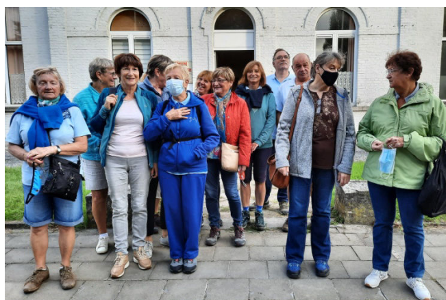
16) Le groupe des marcheurs (euses) au départ.