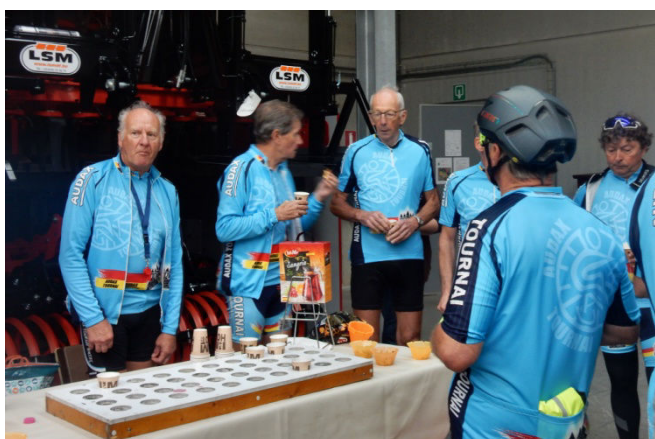
15) Petit drink avant la remise en route des cyclos.