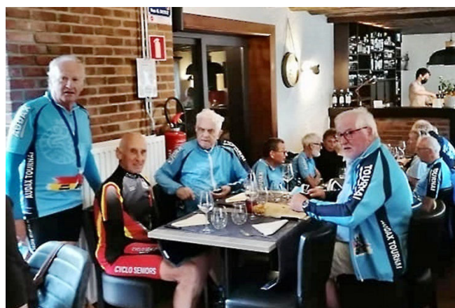
21) la salle pouvait accueillir 50 convives pour un menu convenu au prix de 25€ sans les boissons.