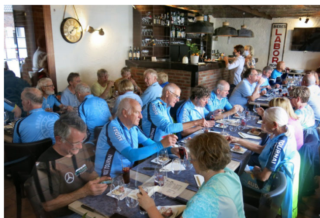
23) Mais chacun sait que l'appétit vient en mangeant C'est l'heure de la convivialité après sport et culture.