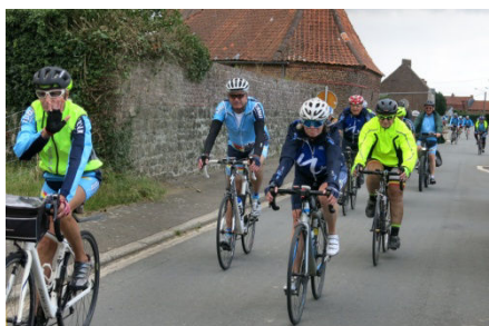
17) Entre Herchies et Ladeuze la distance n'est que de 5 km.