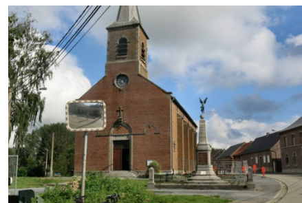
10) Ni à l'église ni au jeu de balle de Ladeuze en entité de Chièvres.