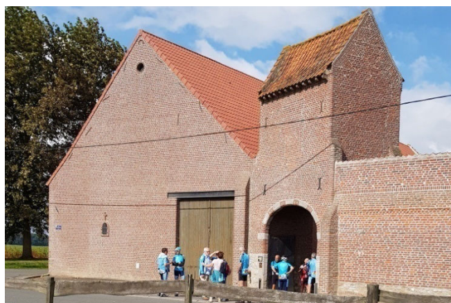
12) Arrivée à la ferme monumentale qui fut la ferme natale de JClaude Dramaix. Visite en vue de 10 12h.