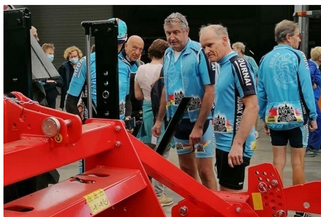
14) Parmi les machines agricoles, étudiées sur place, des décompacteurs et des déchaumeurs.