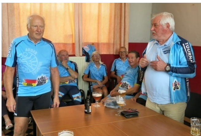
35) Retour au local pour le dernier verre. L'occasion de se complimenter d'une journée, sportive, culturelle et conviviale de bon cyclotourisme.