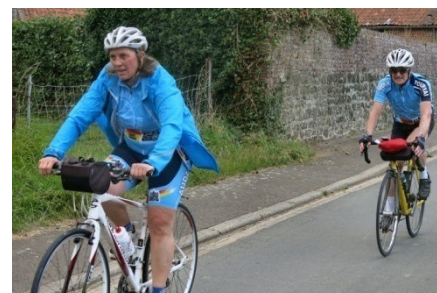
19) le tout est d'arriver à la bonne heure, juste avant l'averse.