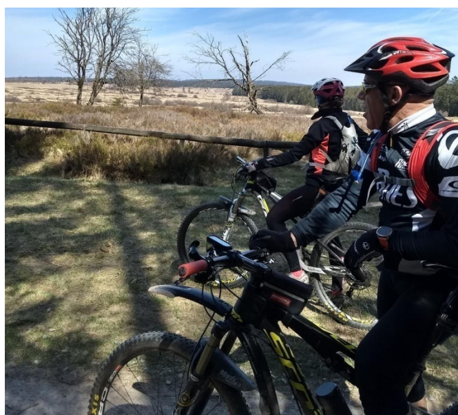
Vtt Philou Fagnes

VTT Fin avril c'était au tour des VTT de se faire plaisir quelques jours à Malmedy. Les Fagnes sont vraiment un endroit superbe pour marcher et rouler.