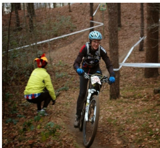
Vtt Chouchou Allemagne Duathlon de l'Enfer