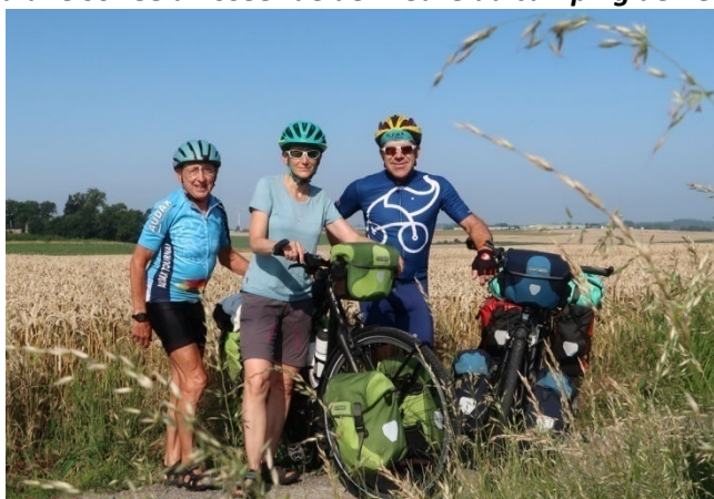
Nos vélos cyclo-camping tout équipés avec guidage vocal et détecteur radar "Coyote"