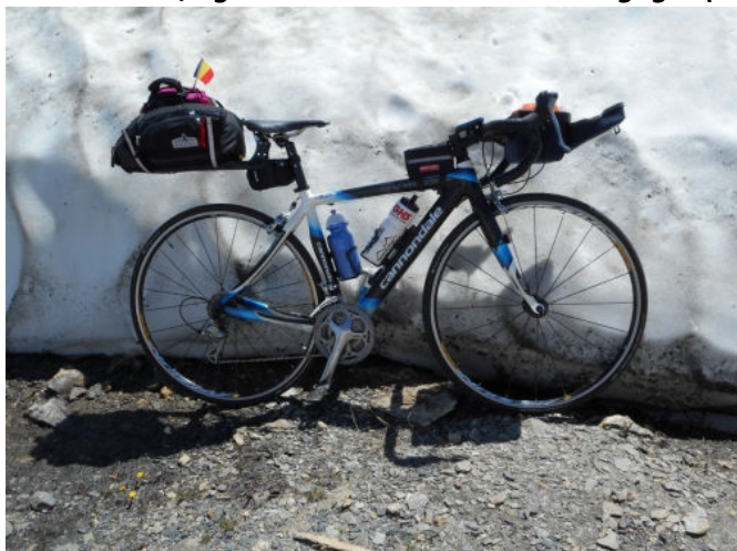
Vélo Chouchou enneigé

Pour ne pas faire de jaloux, quelques semaines après nous avons embarqué les vélos de route à la conquête des Ardennes, également en itinérant avec bagages (voir article dans cette revue).