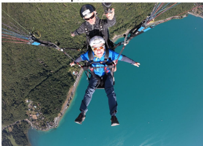
3 Mode "Para" pour Philo