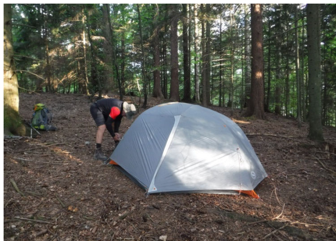
8 Façon bivouac. Quatre jours sans se laver... ça fait du bien