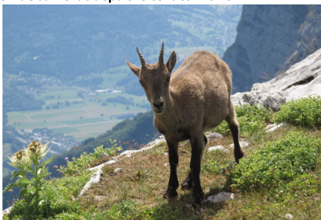
Tu veux ma photo !

Ce fut notre plus longue côte à pied : 16 km et 1200 D+ pour monter au Semnoz à partir du lac d'Annecy. Et pour terminer en beauté, nous avons quasiment fait le tour en parapente, un vol d'1h15 magique et magnifique !