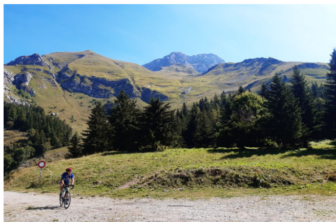
6 Montée du col Chevel en Gravel