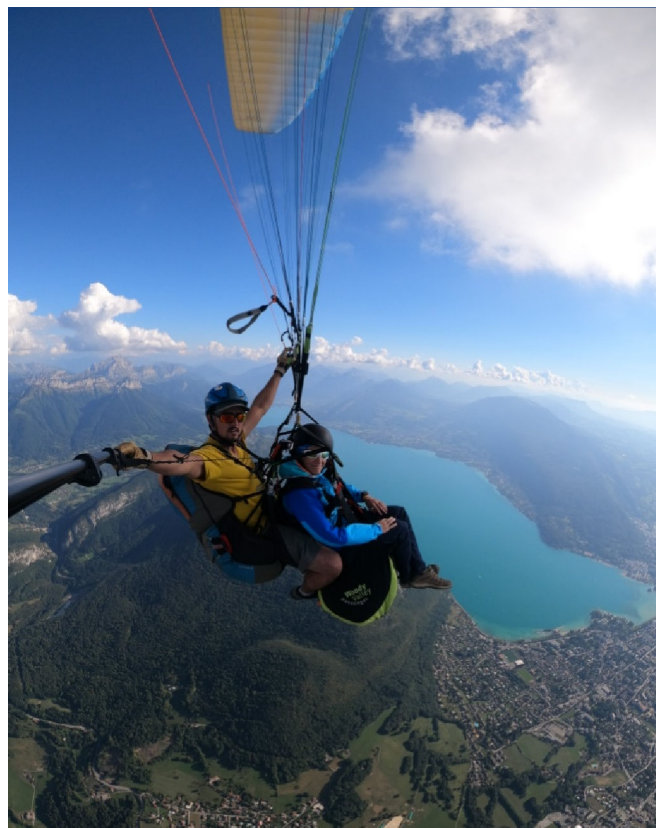
2 Même pas peur