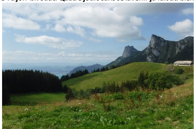
10 Tour du lac à pied