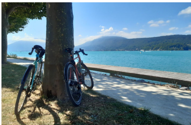
5 En vélo "Gravel"