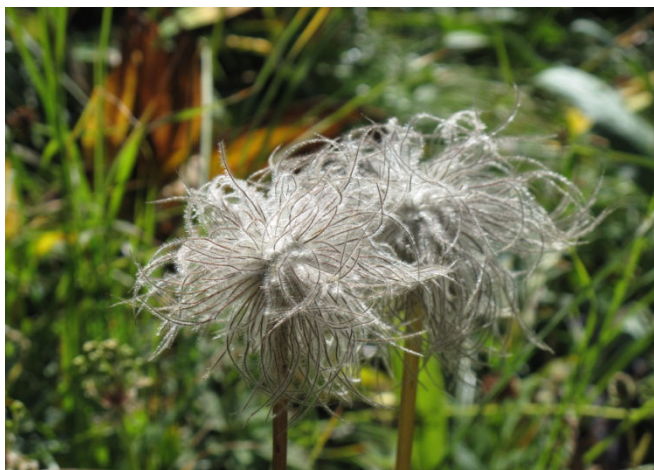
7 Anémone des Alpes qui devient fruit lorsqu'elle fleurit