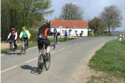
10) Croisement après Bapaume.