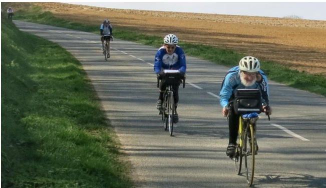
13) Superbes routes de la somme en terres de Poilus