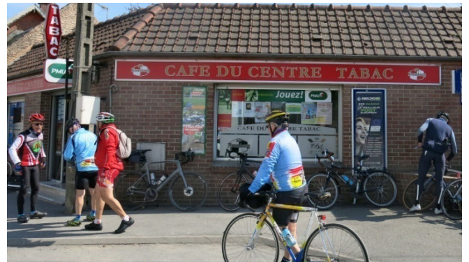
14) Retour en Nord avec Oisy le Verger, au sommet.