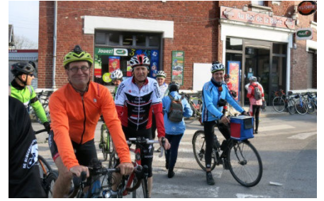
09) Arrive le contrôle d'Arleux.