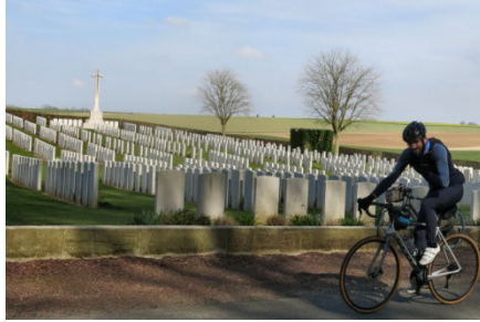
11) Antoine au cimetière de Quéant