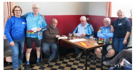
18) Journée Audax terminée à 19h.