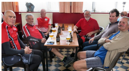
17) Participation de 11 Antoiniens.