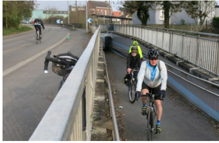
08) Le groupe va se reformer.