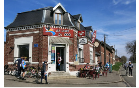
12) Demi tour à Ramecourt.