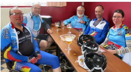
16) Prolongation amicale et familiale