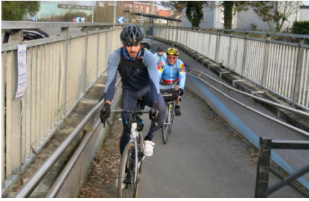
07) A Montigny on sort du tunnel.