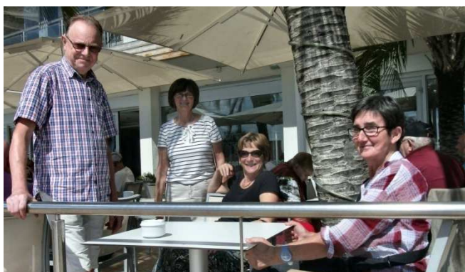
3) Ambiance vacances à Rosas sur la Costa Brava.