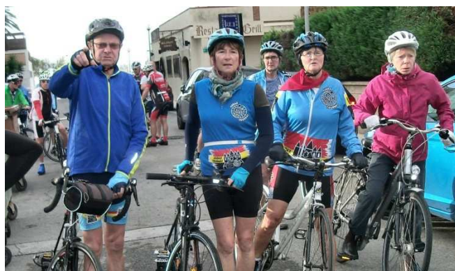
4) Et ambiance vélos pour de nouvelles découvertes.