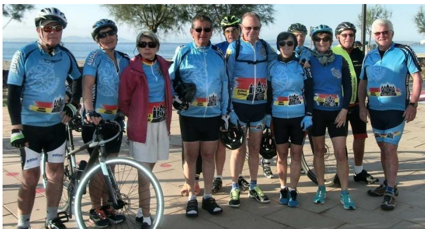
6) Les 12 Audax Tournai du séjour presque tous réunis pour la photo.