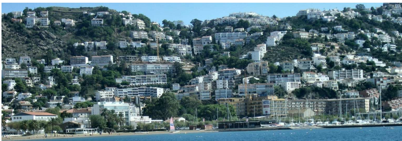
5) Du bateau se rendant à Cadaquès, vue sur la plage de Rosas et l'arrière pays ensoleillé... et construit.