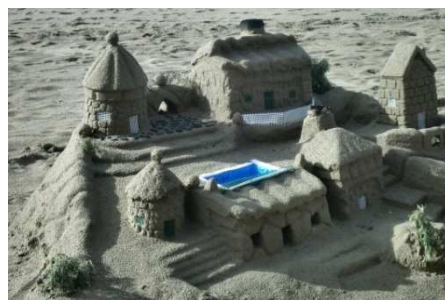
7) Quand on est en Espagne durant 8 jours, on a le temps de se distraire entre amis, rouler à vélo, manger et boire... et construire des châteaux