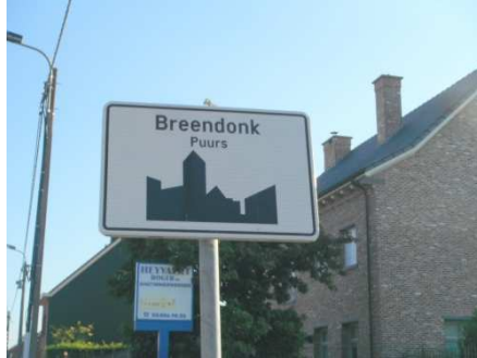
2 mon 1 er contrôle