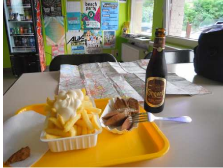
11 Une bonne frite mayo pour couronner le tout