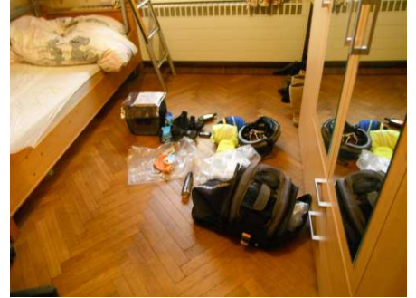
9 Vu l'heure tardive, le rangement se fera plus tard