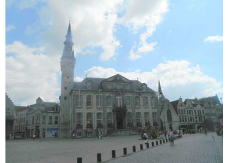
3 Hôtel de Ville d'Anvers