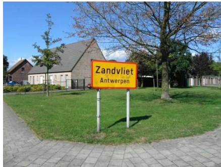
5 Point extrême (NW) du Tour de la Province