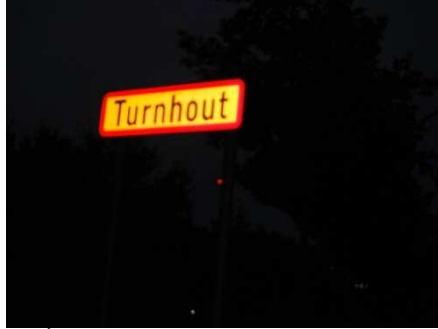
8 6 ème contrôle et un peu de km en sus d'où la prise dans le noir