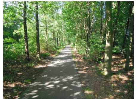
6 Les cyclistes sont rois