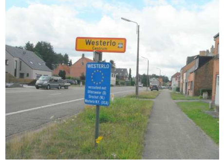
12 Westerlo et fin du voyage