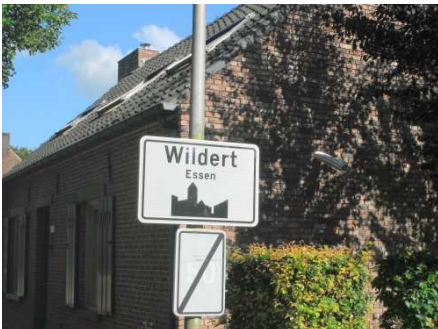
7 5 ème contrôle presque à la frontière des Pays Bas