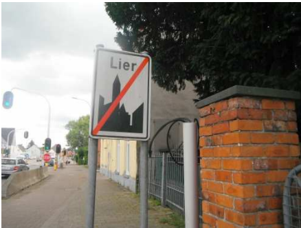
4 Lier, ville de nombreux départ de BRM