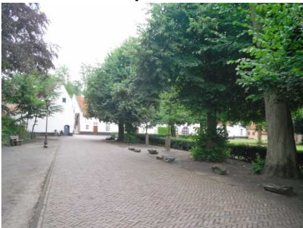
10 Postel et son abbaye Norbertine (de l'ordre de Prémontrés)