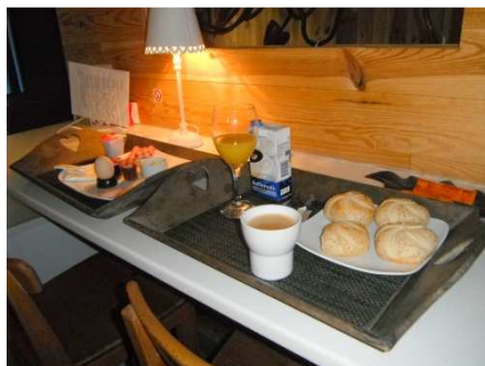
8 Petit déj copieux compris dans le prix