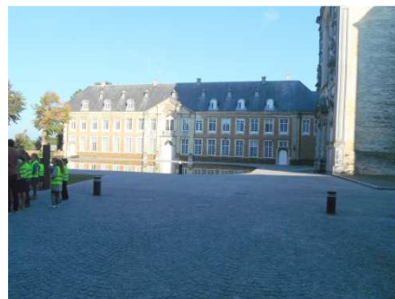
9 Averbeke et son Abbaye