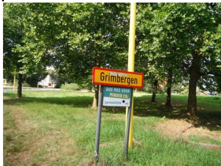
11 Grimbergen fin du périple