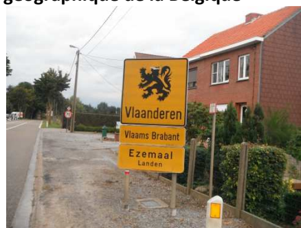
6 Passage en Brabant Flamand