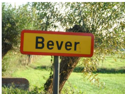
2 Départ et 1 er Contrôle