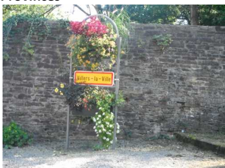
4 Villers la Ville, point extrême Sud de mon périple