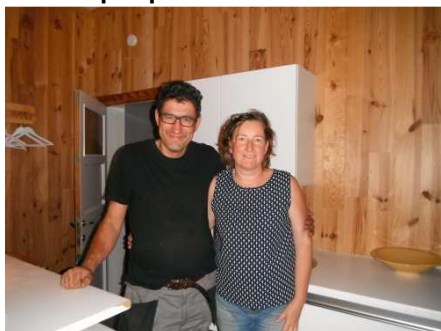
7 Fin de ma 1 ère étape 198 km, accueilli par ces jolies personnes