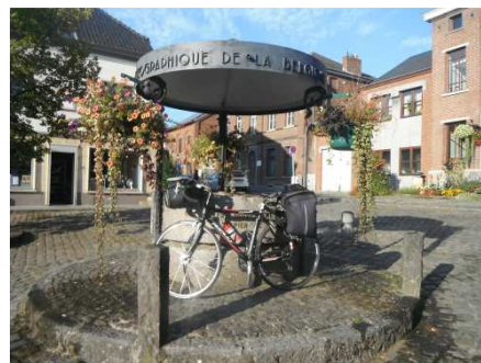
33 Ittre, 2 ème contrôle. Centre géographique de la Belgique