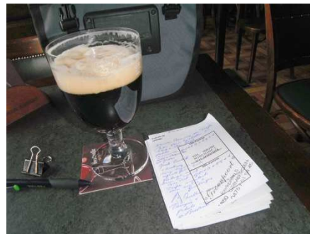
12 Quelques notes et une bonne Grimbergen pour savourer