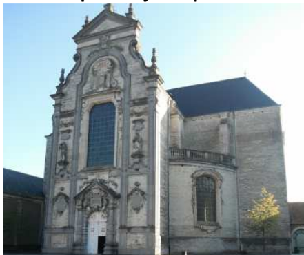
10 La très belle façade