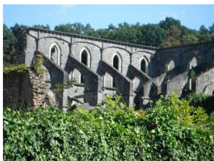
5 Vestige de l'Abbaye de Villers la Ville