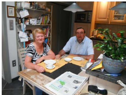
5 Les très sympathiques propriétaires du gîte