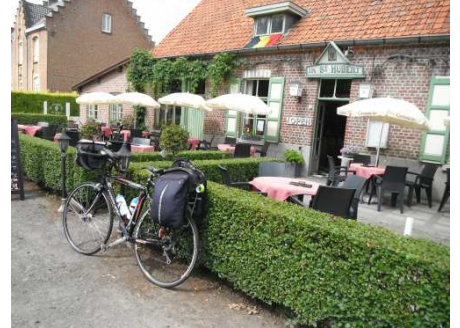
3 Petite guinguette au bord de l'eau