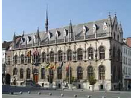
2 Le très bel Hôtel de ville de Courtrai