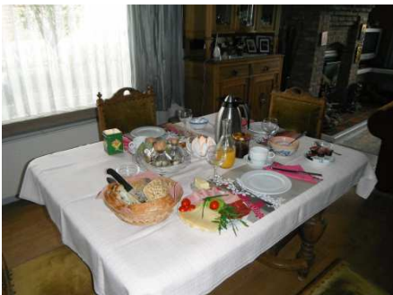
4 Comme à la maison