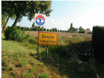
2 Deurle mon 1 er point de contrôle