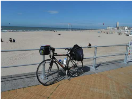
4 Knokke et son casino mai aussi ses plages de sable fin