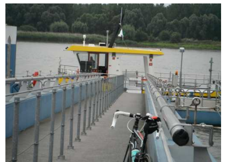
6 Traversée par bac sur l'autre rive pour terminer mon périple