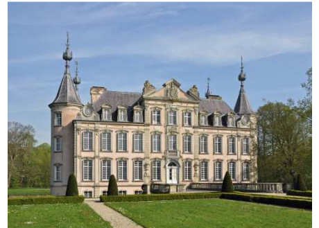
3 le château de Poeke