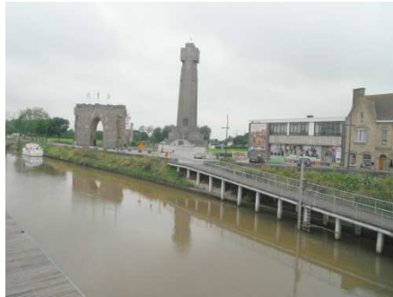
5 Dixmude et sa célèbre tour de l'Yser