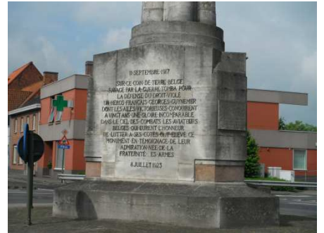
6 Poelkapelle avec le monument funéraire de Georges Guynemer