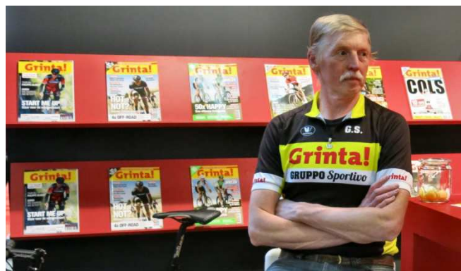
07) La revue flamande qui parraine notre Grinta !