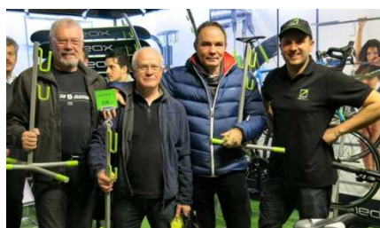
16) Néox, entreprise boraine.