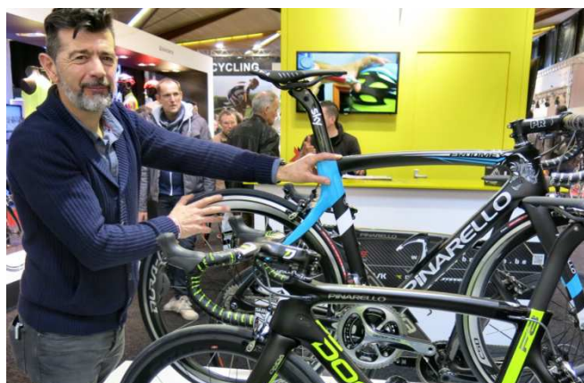
04) Visite guidée d'un Enghiennois du stand Pinarello