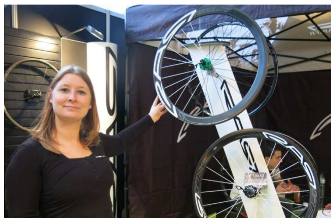
05) Fabrication artisanale des Roues RAR à Bavay.