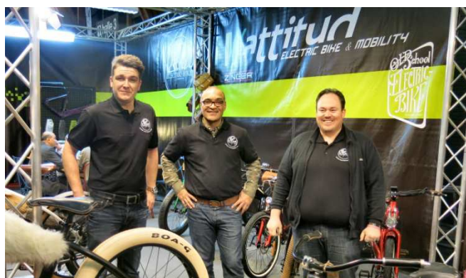
14) Entreprise cycles à Tournai : qui roule avec ?