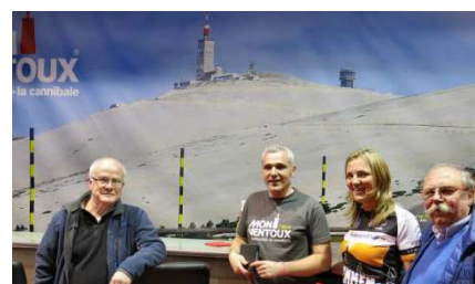
18) Rêves de hauteur Velloffolies !