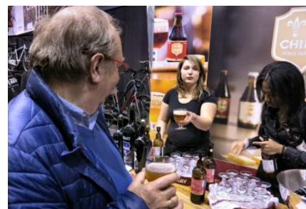
10) Avant, impossible de résister !