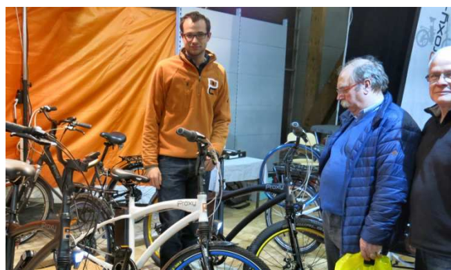
15) Cycles Proxy, VAE au piétonnier de Tournai.