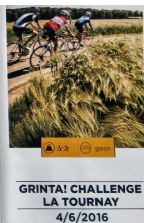
03) Petite sélection des autres épreuves cyclo reprises dans le Cycling Tour 2016. Toutes garanties de succès ! Golazo organise aussi le « Tour du Mont Blanc, le 16/07/16, réussi par le président FFBC (Inscription : 130€ !)