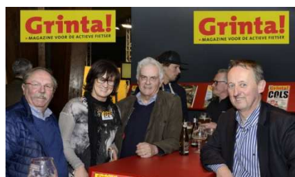
17) Au stand Grinta ! les patrons.