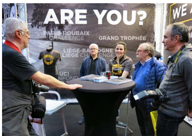
01) Au stand Golazo se retrouvent des « accros ».

Quand, de Tournai, on pratique et aime le vélo c'est une aubaine que de visiter un salon du vélo proche et de grande qualité. Quand on est Audax Tournai il n'est pas malheureux d'y rencontrer des gens de connaissances. Et quand on soigne la réputation de son club on s'attarde à des stands avec des arrières pensées... d'abord quasi professionnelles. Ainsi se fait-on des amis dans le milieu !