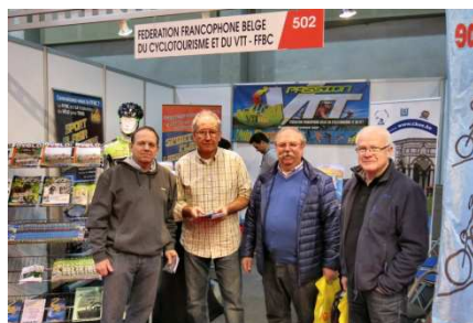
08) Visite cordiale au stand FFBC.