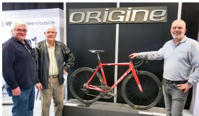
06) Vélos Origine monté à Marly et livré par internet.