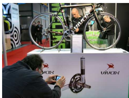
11) Moteur caché ? En vente libre.