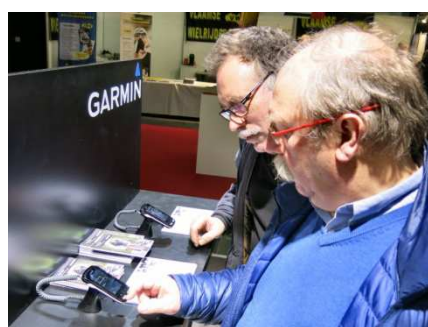
12) Nouvelle technologie Garmin.