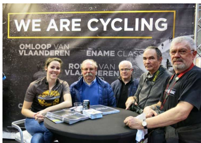
02) La Grinta ! des Audax Tournai figure au calendrier