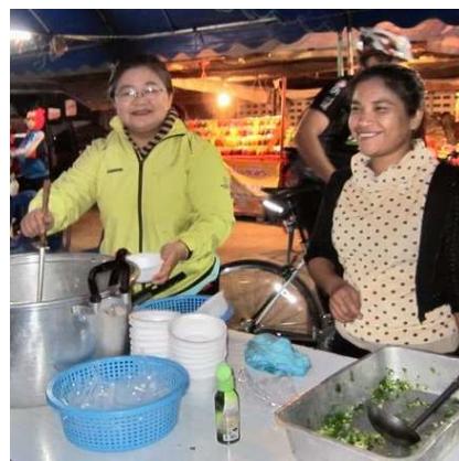
3) Soupe de départ tôt le matin.