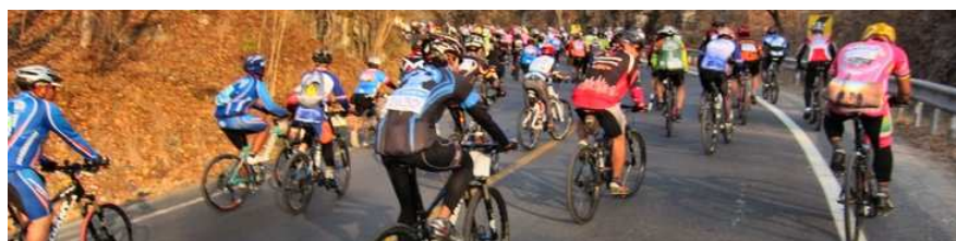
3) 2300 participants groupés (au départ !), route et vtt : bouchon !