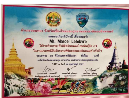
9) La fierté d'un Diplôme écrit en Thaï mais bien à son nom.