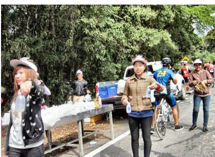
6) Nombreux et sexy ravitos ...