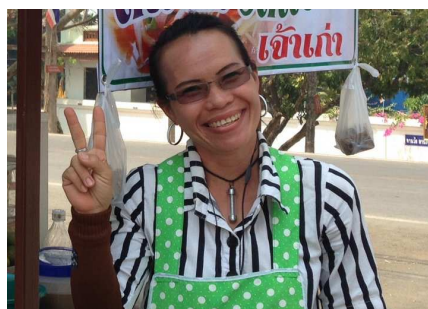
5) Une amie qui lui veut du bien !