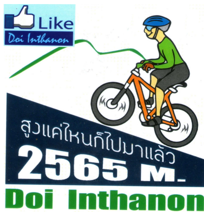
2) Soit 2239m d'élévation en 48 km.