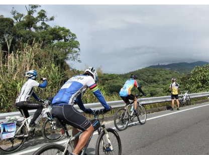
7) ... mais brouillard au sommet !