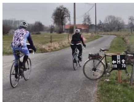
07) Dans le froid on préfère le 70 .