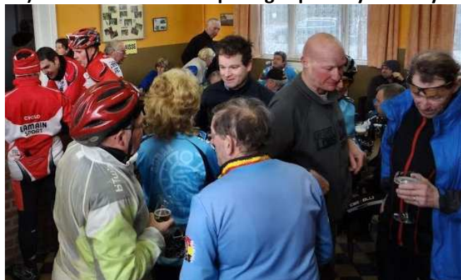
14) Réchauffement général dans le local des Audax.