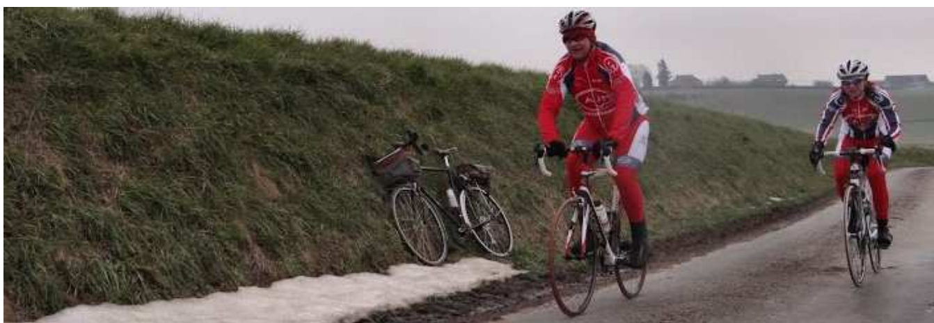
10) Un Samedi de Pâques, le 30 mars, où les traces de neige sont encore présentes dans certains fossés.