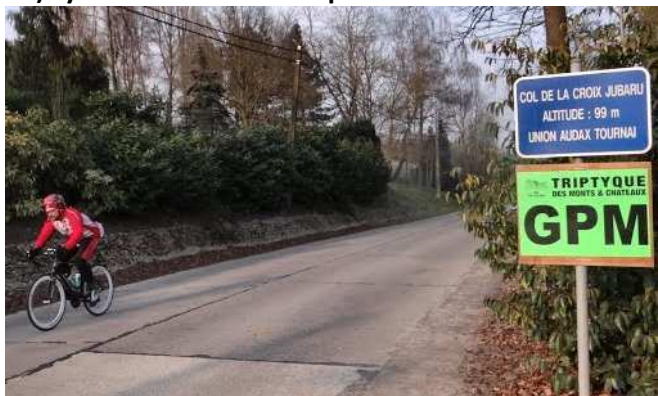
13) Traditionnel passage au col de la Croix Jubaru.