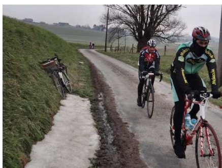
05) Parcours marqué par le froid