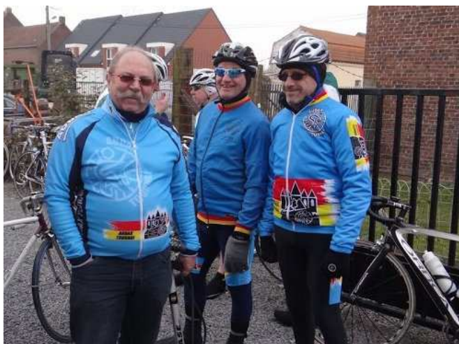
01) Il fait beau et sec mais le vent sera glacial. Malgré tout 424 cyclos dont 45 Audax ont fêté Pâques.