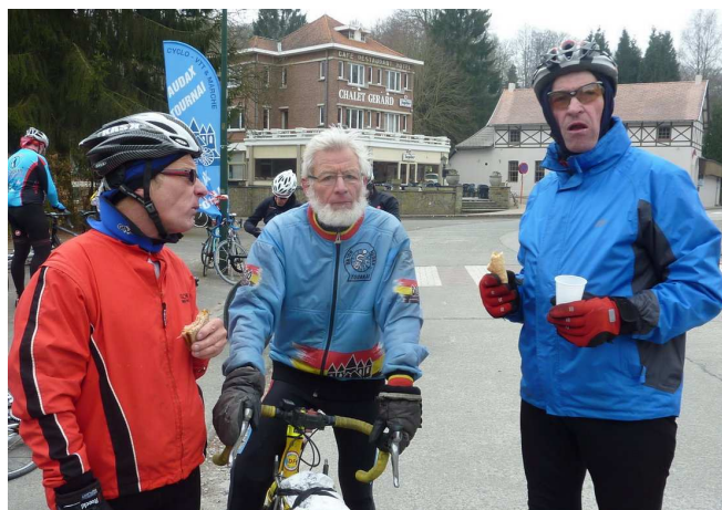
09) Donc préférence du 110 pour les Randonneurs.