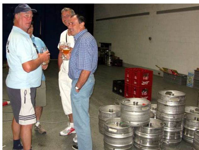
04) Gardiens et dégustateurs de fûts Ename.