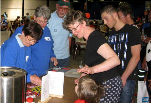
07) Vente des tickets boissons dans le hall.