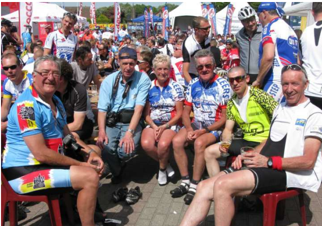
11) Fin de journée sportive de cyclos ensoleillés.