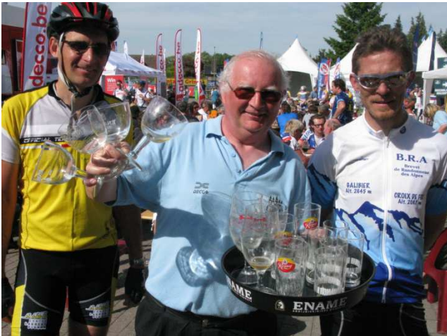
09) Véritable chef d'orchestre du verre vide.