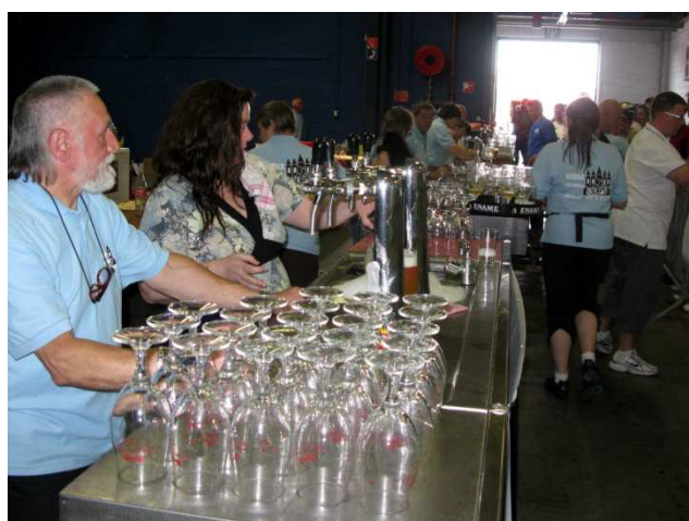
06) Une organisation pour servir 4215 cyclos ! ...