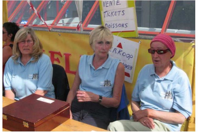
08) Vente des tickets boissons sur la terrasse.