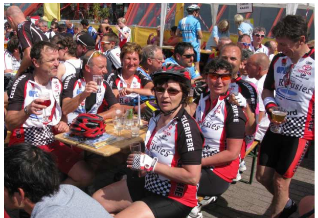
12) Participation du club de Rousies, Nord France.