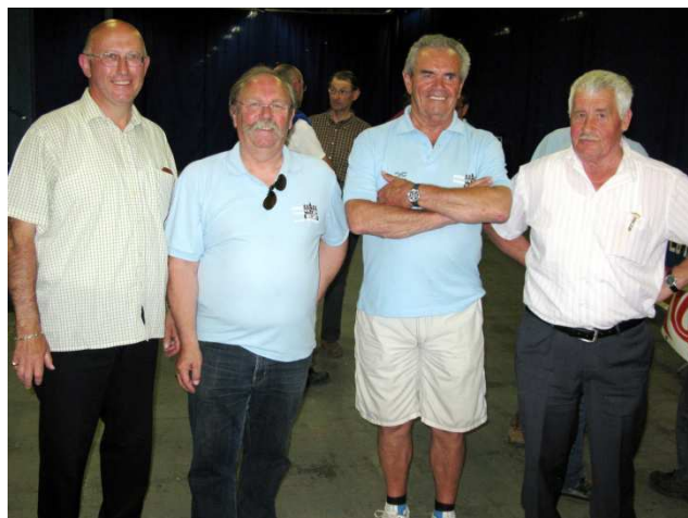
02) Audax avec le concours du Cazeau Pédale.