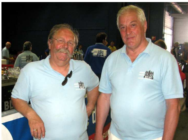
01) Président et Secrétaire à la barre de la Grinta !

Certains prêchent dans le désert pour des organisations cyclotouristes accessibles à tous (?) à la FBC. Les Audax Tournai travaillèrent pour accueillir, à Tournai le samedi 07 Mai, 4215 cyclos sur le parcours des Monts de Frasnes. Gros succès de la 4 e Grinta ! Challenge la Tournay.