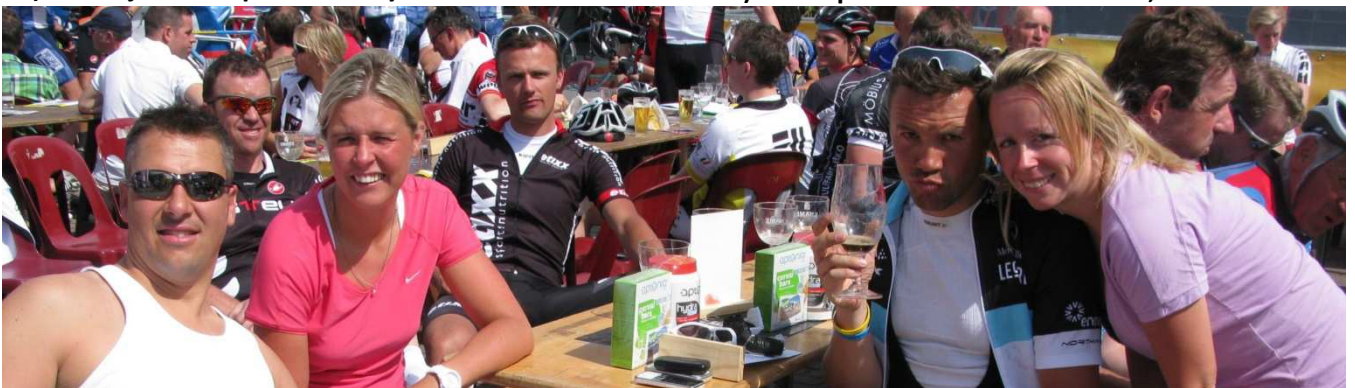
13) Nombreux jeunes cyclos et nombreuses cyclotes parmi les 4215 participants de la Grinta ! Tournay.