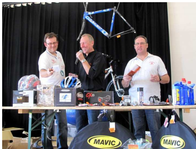
02) Grande Tombola de clôture, bien dans la grande tradition d'un grand Challenge des Picardes.