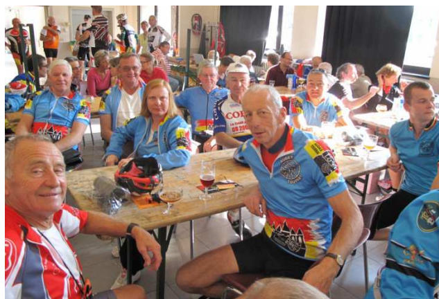
04) Audax joyeux, côté droit, à la clôture en fête.