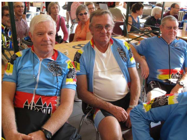
05) Dans l'attente des gros lots de la tombola.